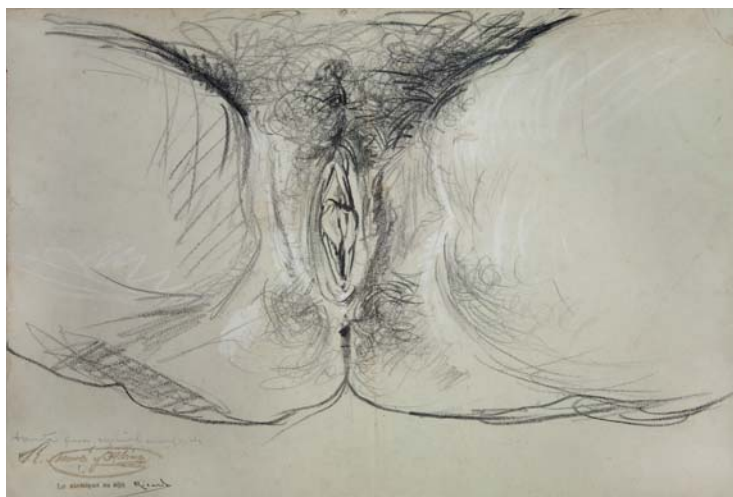
Figura 10. Ramon Martí Alsina, Sexo femenino (hacia 1870). Palau Antiguitats, Barcelona.

Como ya comentamos en su día 67 , resulta paradójico que el pintor que, a nivel ideológico, siempre sostuvo una actitud de rebeldía y abierta confrontación con el ideario académico, ejercitara, con una desconcertante asiduidad, este tipo