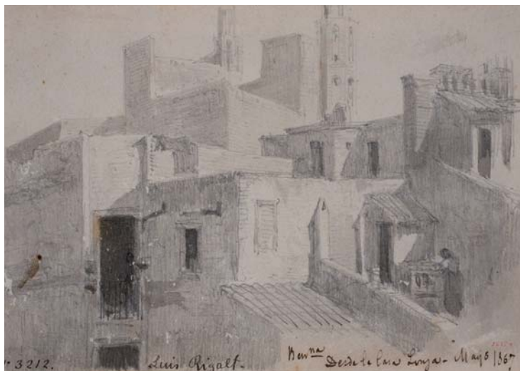
Figura 16. Lluís Rigalt Farriols, Vista de los tejados de la ciudad de Barcelona (1867). Gabinete de Dibujos i Gravats, MNAC, Barcelona.

Tampoco podemos menospreciar la aportación de Lluís Rigalt 91 a la configuración de la imagen icónica de la ciudad de Barcelona. Sin distanciarse del tipismo y del pintoresquismo más tópicos, el autor construye un itinerario por algunos de los lugares más emblemáticos de la geografía barcelonesa. A diferencia de otras propuestas de este mismo signo, las realizaciones de Rigalt transmiten un aire más libre y espontáneo. A ello también contribuye la propia naturaleza de las composiciones. Se trata de un conjunto de dibujos, la mayoría de los cuales presenta una factura muy abocetada, sin más pretensiones que las que puedan derivarse de la práctica de ejercitar la capacidad de observación.