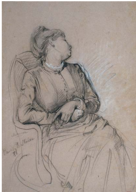
Figura 5. Ramon Martí Alsina, Mujer dormida en una butaca. Antoinette (1878). Gabinet de Dibuixos i Gravats, MNAC, Barcelona

pintor son completamente opuestos al gusto y a la sensibilidad que caracteriza el trabajo de los pintores afines a esta cultura figurativa.