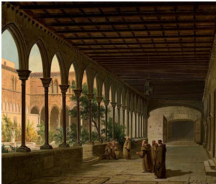
Figura 14. Achille Battistuzzi, Vista del claustro del monasterio de Santa María de Junqueras (1867). En comercio.