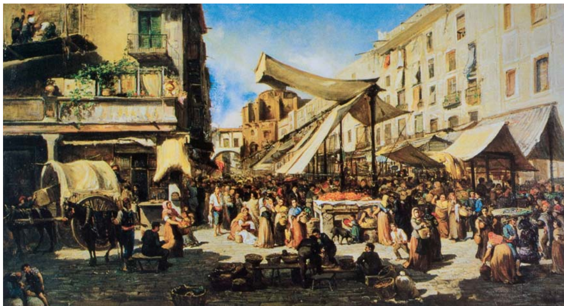
Figura 19. Ramon Martí Alsina, El Borne antiguo (1878). Departament d'Economia i Finances de la Generalitat de Catalunya.

cha de realización de cada una de las pinturas. Mientras que la tela del MNAC parece plausible considerarla como una realización de finales de 1860 99 , la otra versión fue realizada en una fecha tan tardía como la de 1878.