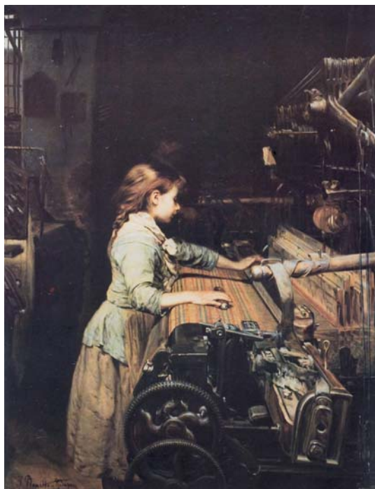
Figura 2. Joan Planella Rodríguez, La niña obrera (1882). Colección Trinxet.

Es lógico pensar que en este contexto social, con una correlación de fuerzas claramente deslizada hacia la defensa de los intereses de la oligarquía financiera, los grupos sociales más desfavorecidos, más allá del tradicional antagonismo de clases, difícilmente podían gozar de alguna oportunidad que les permitiera construir un relato iconográfico propio. Su presencia, como veremos más adelante, será meramente testimonial. En algunas producciones pictóricas, tendrán un papel secundario, como acom-