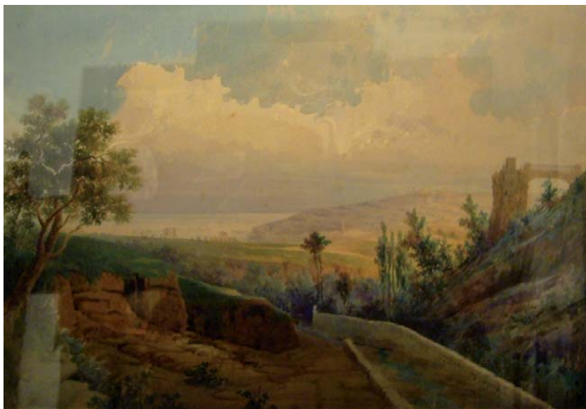
Figura 13. Achille Battistuzzi, Vista del puerto de Barcelona (1881). En comercio.

Es interesante subrayar, como un elemento novedoso en la poética del siglo XIX, el descubrimiento de la ciudad como fuente de experiencias artísticas; una interpretación estética, eso sí, alejada de la mirada poética de Charles Baudelaire (1821-1867), que contempla la vida urbana como una realidad dual y contradictoria, puesto que es al mismo tiempo paraíso e infierno. El efecto estético del destello fugaz, convertido en materia de recreación poética, se acompaña de un mensaje desesperanzado ante la perspectiva de un progreso económico y social que todo lo envilece. Para Baudelaire, la ciudad, concebida como un espacio artificial —opuesto a la naturaleza— permite destellos estéticos fugaces y