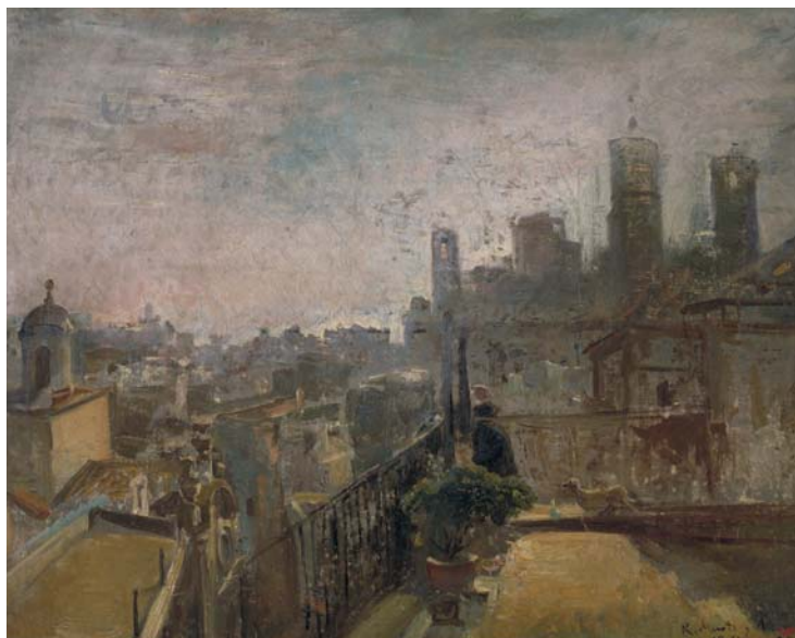
Figura 20. Ramon Martí Alsina, Vista de Barcelona desde un terrado de la Riera de sant Joan (1889). Museu Nacional d'Art de Catalunya, Barcelona.

Sin embargo, como los primeros, igualmente se encuentran a caballo entre dos movimientos perfectamente bien definidos y, como ellos, también comparten un lenguaje de hibridación presidido por un alto grado de eclecticismo, si bien su poética los acerca más a un neofortunyismo o incluso podrían ser etiquetados como tardopreciosistas, continuadores de la estética fijada por Fortuny. Si regresamos a la primera generación de autores pseudorealistas —a los nacidos en un período anterior—, lo cierto es que no existen entre todos ellos —Benet Mercadé (1821-1897), Antoni Caba (1838-1907) y Simó Gómez 102 (1845-1880)— demasiadas coincidencias estilísticas o una filiación con la obra de Martí Alsina que permita deducir la existencia de una influencia de este último sobre el resto.