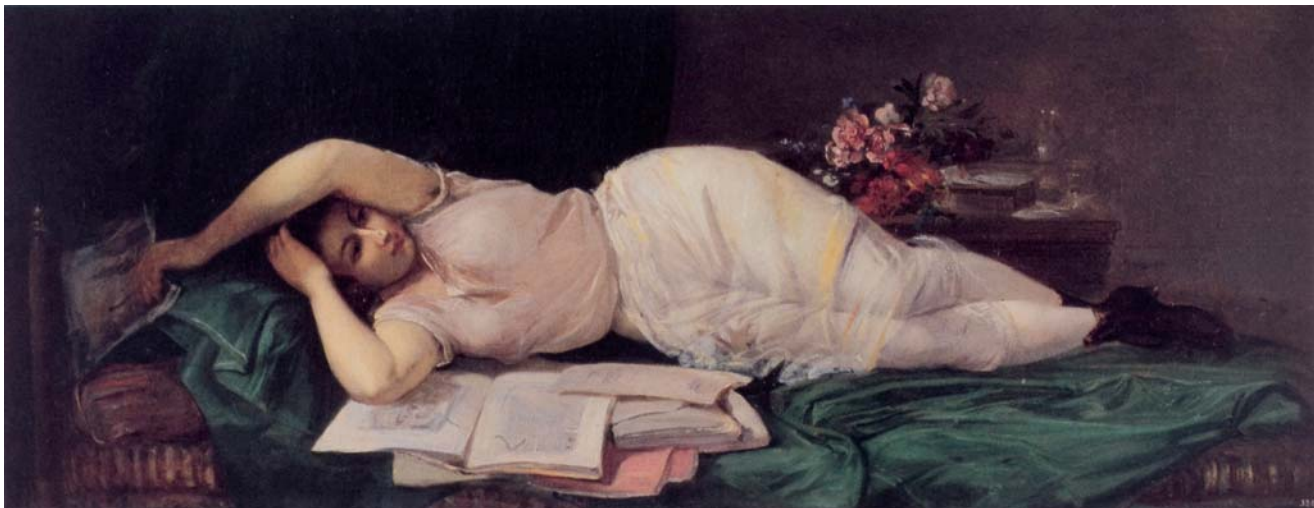
Figura 9. Ramon Martí Alsina, La mujer del divan (hacia 1870). Museu-Fundació Pau Casals, El Vendrell

o la transgresión moral 64 que sí que reconocemos en la pintura de Gustave Courbet, en cuyas escenas, presididas por una envolvente y provocadora ambigua moralidad, parece inspirarse.