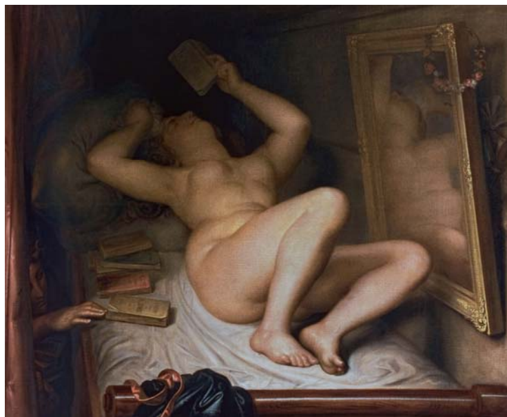
Figura 8. Antoine Wiertz, La lectora de novelas (1853). Royal Museum of Fine Arts, Bruselas, Bélgica.

tud de la castidad matrimonial confrontada a la oscura tentación del adulterio, de la infidelidad, que representaría la figura del demonio.