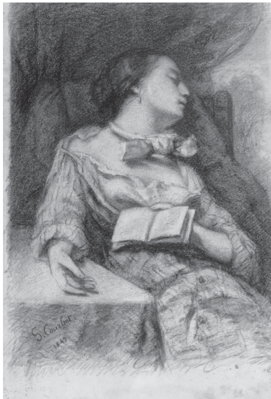
Figura 4. Gustave Courbet, La lectora dormida (1849). Musée d'Orsay, París.