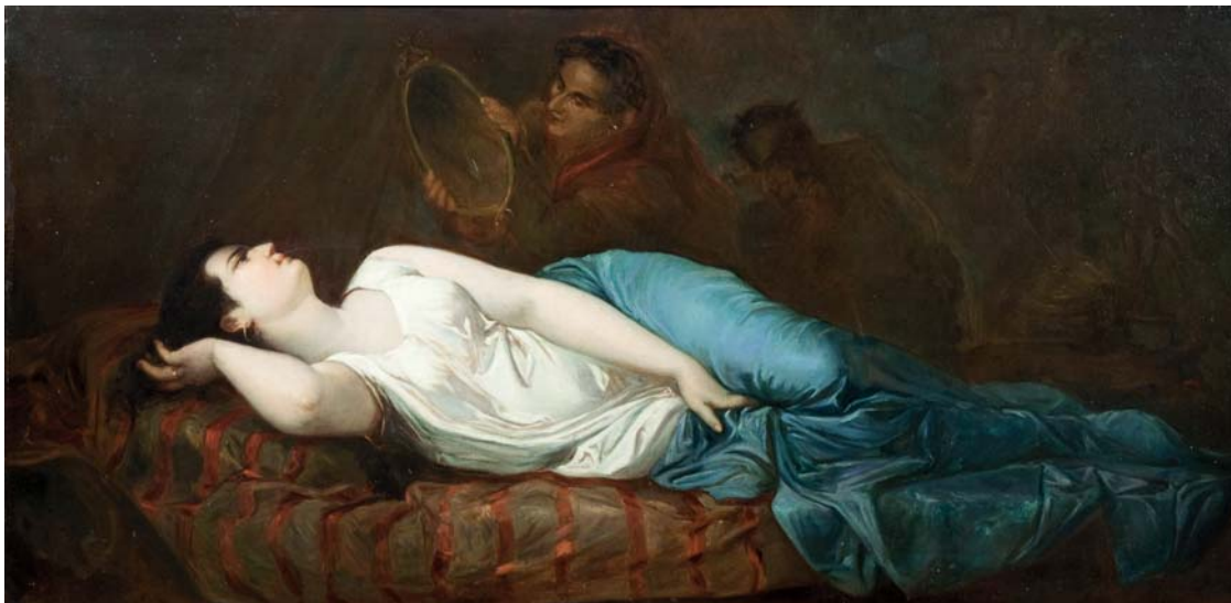
Figura 7. Ramon Martí Alsina, El sueño (?) o Vanitas (?) (hacia 1870). Colección particular

una citación erudita de una conexión con la tradición pictórica, que como un ejercicio de recuperación nostálgica del neoplatonismo estético que preside la obra de Giorgione o Tiziano. Es evidente que esta última tipología temática hunde sus raíces en la recuperación de los modelos pictóricos alegóricos. En este caso, la modelo femenina, protagonista de la composición, yace vestida en un lecho y aparece situada en un primer término, siguiendo una estructura compositiva idéntica en todas las realizaciones que de estas características han llegado hasta nosotros.