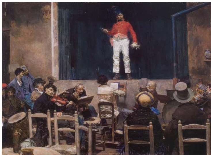
Figura 6. Romà Ribera, Café cantante (1876). The Corcoran Gallery of Art, Washington

En cualquier caso, el estilo que practica Ribera se inserta en los habituales parámetros de la pintura preciosista, presididos por una técnica virtuosa y una factura brillante, destinada a recrear efectos visuales muy atractivos para el espectador. En este sentido, el «realismo» 46 de Ribera queda atenuado o incluso neutralizado por estas servidumbres técnicas, por una desmesurada pulcritud y, sobre todo, por una pa-