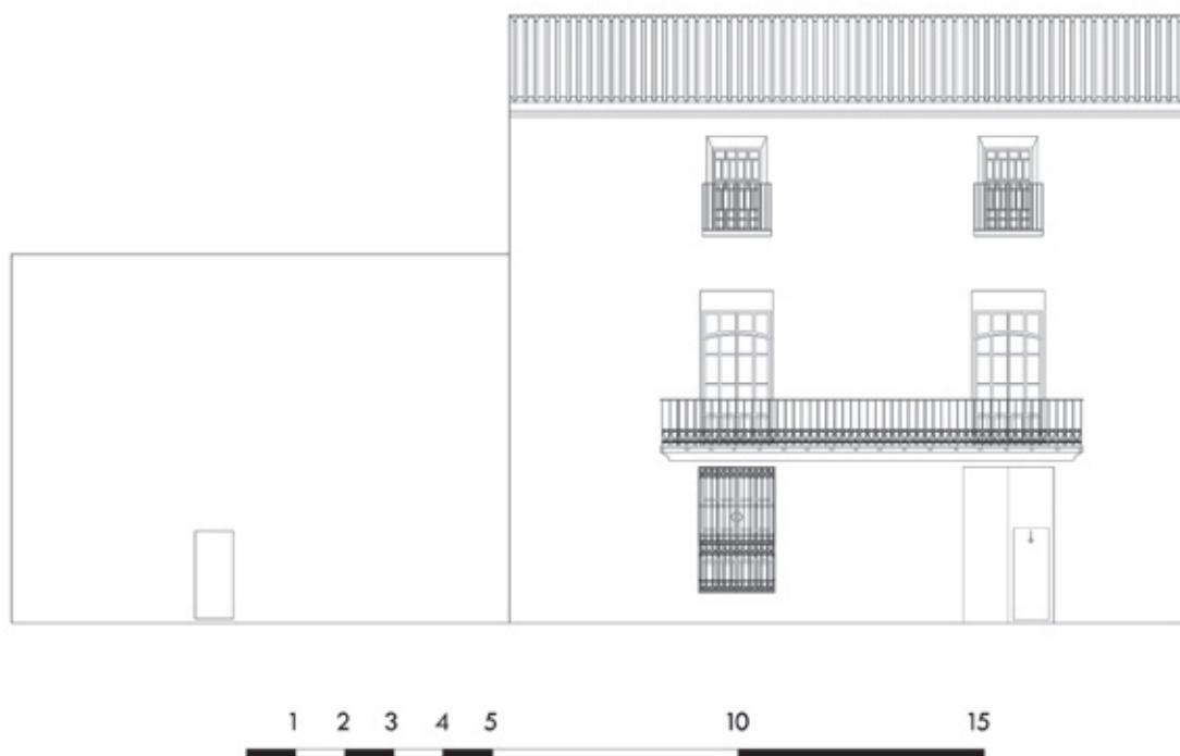
Figura 3. Casa dels Sant Ramon Bonivern al carrer de Montcada.

anys després de la seva construcció, adquirissin aquest immoble avui conegut amb el seu cognom. Així, en moltes ciutats era habitual que les famílies més poderoses s'agrupessin 15 . Els Sanç n'eren el cas xativí més evident.