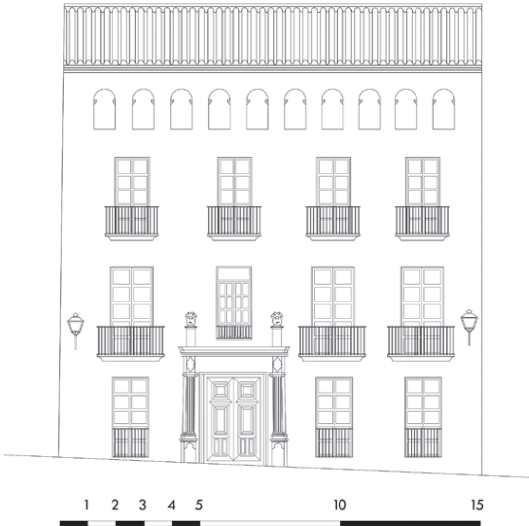
Figura 6. Casa Gran o dels Cebrián del carrer de Jacint Castanyeda.

rien, o comprarien, grans immobles, de la mateixa manera que al llarg de centúries anteriors ja havien fet alguns professionals liberals com ara metges, juristes o notaris. La noblesa que va aconseguir mantenir el seu estatus durant l'edat moderna se'n va sortir després d'haver reorganitzat les seves fonts d'ingressos i de començar a participar en els òrgans de poder de la monarquia. Arran d'això, també va intervenir en la renda centralitzada generada per la fiscalitat real 28 . Aquesta readaptació li va permetre seguir imposant-se com a cèl·lula primària en la societat, com a marc d'organització de les relacions entre els homes, i també li va permetre estar al capdavant de la dominació com a classe social.