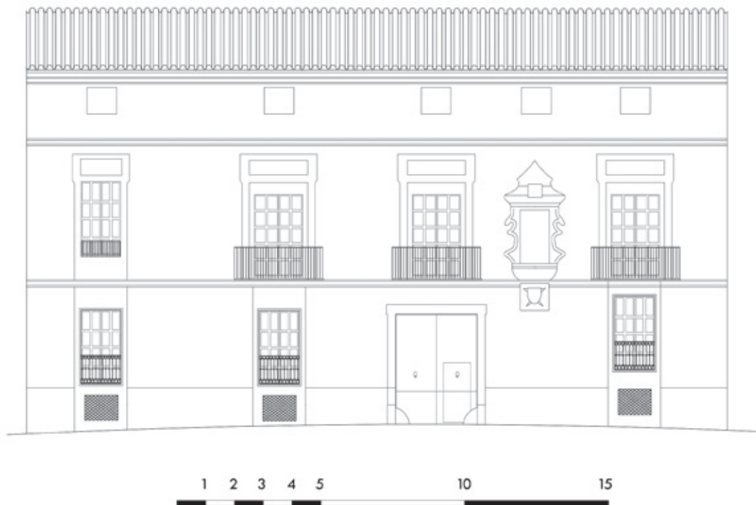
Figura 5. Palau del baró del Sacre-Lliri al carrer de l'Àngel.

gulars, sobre les quals alçaven edificis de quatre plantes que, com a aspectes comuns, es trobaven dividides entre semisoterrani i entresòl, als quals s'accedia mitjançant un ampli vestíbul que quedava obert al pati; planta noble d'altura considerable i sobre aquesta i per coronar la vivenda, l'andana. El pati central era descobert i al seu voltant s'alçava l'habitatge, on hi havia l'escala que conduïa a l'anteriorment citada planta noble, entorn en què es desenvolupava la vida dels propietaris. Disposava d'un gran espai, un saló, amb una decoració austera. L'altura aproximada dels sostres era de cinc metres i les finestres geminades o d'un estil gòtic, que bé podria ésser encara primitiu, permetien que la llum entrara des de l'exterior. També hi estaven ubicades les habitacions principals dels senyors i les cambres i les sales que funcionaven com a espais de transició. Aquestes cases senyoriales queden enquadrades dins d'una tipologia que es repeteix en gran part del territori mediterrani, de manera que en trobem exemples tant en València com en Catalunya, Balears, Perpinyà, Sicília i Cerdenya, però també a Xipre i Rodes 26 , encara que en el cas valencià la influència arribava directament del gòtic meridional català 27 .