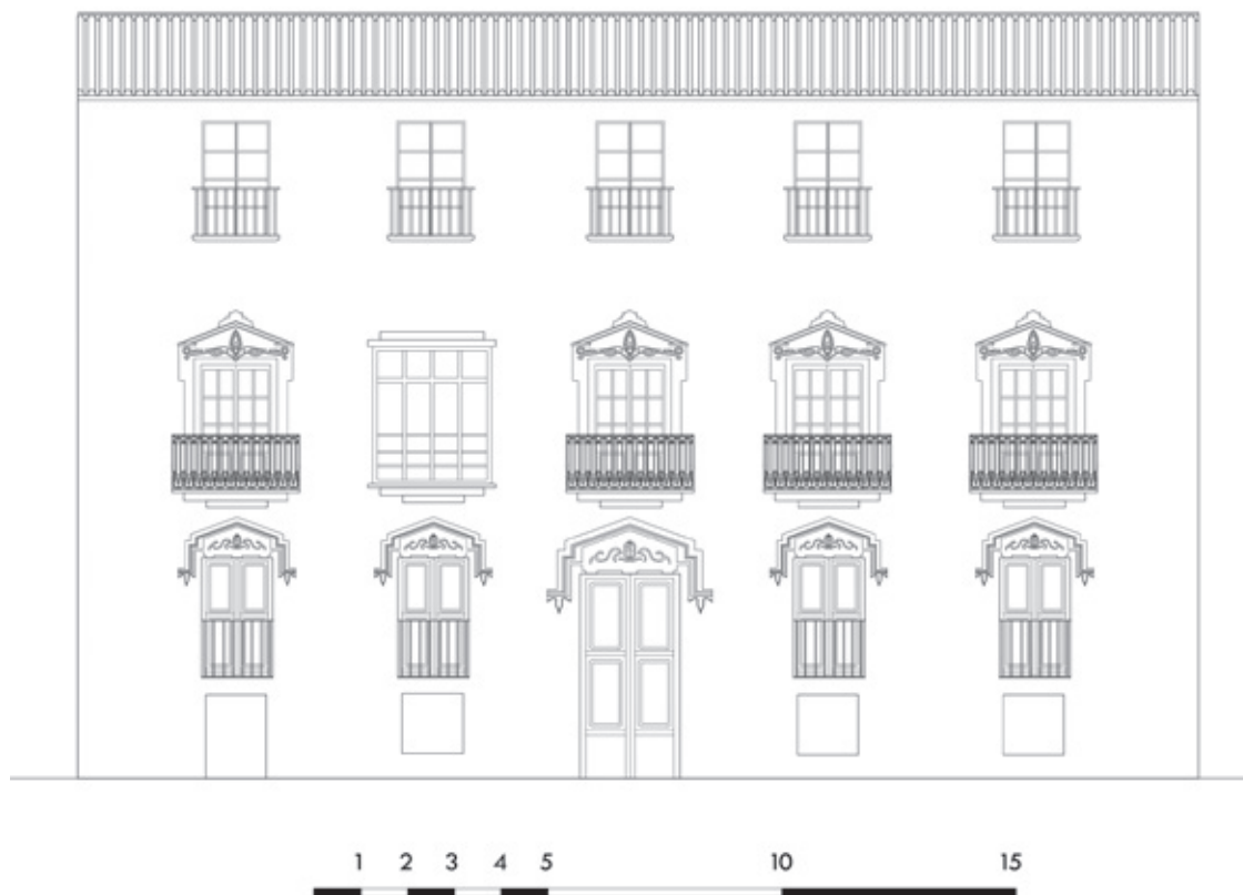
Figura 2. Casa dels Sanç de Sorio al carrer de Montcada.