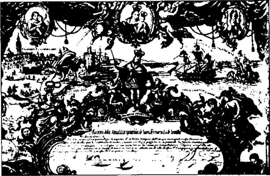
Acció de la Real Compañía de San Fernando de Sevilla