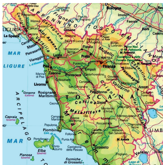
Imagen 1. Valle del Casentino (Toscana).

La leyenda hagiográfica que narra el origen de la ermita de Camaldoli (imagen 2) —estamos hablando de una experiencia monástica de huella eremítica que solo más tarde conoció un desarrollo cenobítico (D’Acunto, 2014)— se inscribe en el marco de una tradición muy antigua, que tiene sus raíces en el anacoretismo de los primeros siglos del cristianismo. Si en aquel momento (pensemos en Antonio, en Pablo y en los otros padres del monaquismo egipcio: Filoramo, 2010), el lugar del encuentro con Dios y de su experiencia vivificadora por medio de la abnegación total de la carne y la renuncia del mundo era el desierto, en la Edad Media occidental el lugar de la separación del mundo y del contacto con Dios empezaba a ser el bosque.