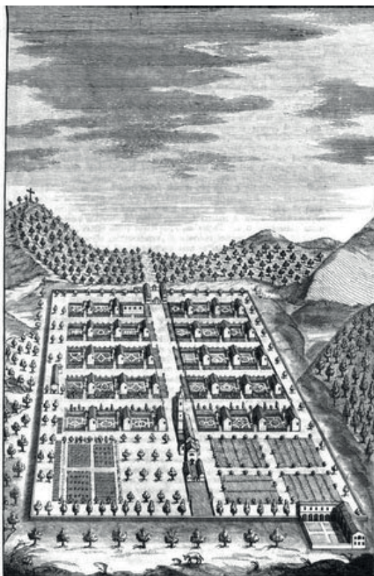
Sacra Camaldulensis Eremus a Carolo Emmanuele I Duce Sabaudiae in Montibus Taurinensibus erecta ex voto anno 1602.

Si bien el bosque de Camaldoli constituye un unicum , hay que decir que la marcada atención a la dimensión forestal se encuentra en todos los asentamientos camaldulenses, los cuales manifestaron la misma inclinación a la relación privilegiada con la naturaleza en los diversos contextos en que se difundió la orden de San Romualdo. Encontramos un ejemplo significativo en Piamonte, donde los Camaldulenses llegaron a principios del siglo XVII, gracias al decidido apoyo de la corte saboyana. Nació una congregación eremítica autónoma, compuesta por cuatro asentamientos (imágenes 4 y 5), el más importante de los cuales fue el de Pecetto, en la colina de Turín, elevado por Carlos Manuel I como sede de la Orden de la Santísima Anunciación.