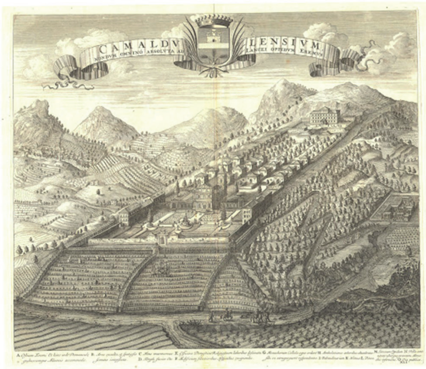
Imagen 5. Ermita de Lanzo (Turín). Theatrum Statuum Regiae Celsitudini Sabaudiae Ducis, Pedemontii Principis , Amsterdam, 1682.

En el origen de este lugar, como también en Camaldoli, se nota la marcada atención hacia las condiciones ecológicas y ambientales como factores determinantes en la localización del sitio, que se quería bien aislado, dotado de agua y de árboles. Si al principio se pensó en la colina de Superga (donde en el siglo XVIII fue construida por Filippo Juvarra la magnífica basílica destinada a acoger los sepulcros de la dinastía reinante), la elección final recayó luego sobre este otro lugar montañoso, lleno de «selvas y bosques» y al que se llegaba después de una «difícilísima subida» (Cozzo, 2018: 198).