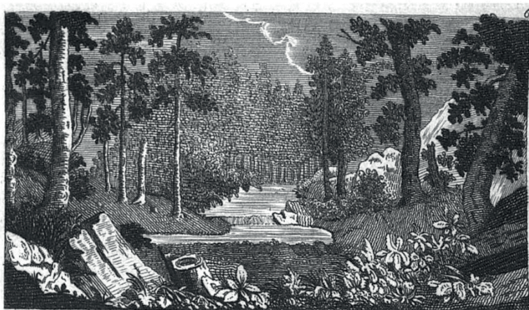
Ingresso del Bosco di Camaldoli

Abies etiam esse valebis, proceritate sublimis, opacitate condensa, insignis viriditate, ut studeas meditare excelsa, contemplari celestia divinamque maiestatem summo vertice pulsare, sapiens que sursum sunt non que super terram (Liber Eremitice Regule: XLVI, 12).