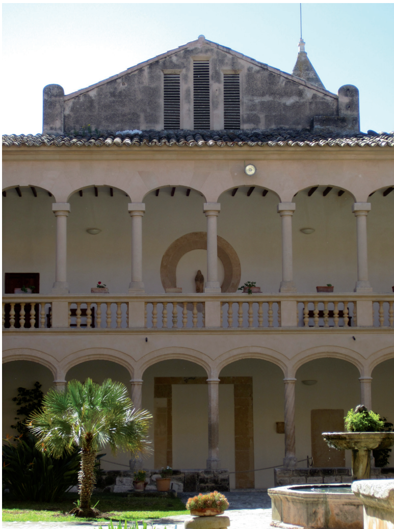
Fig. 2. Santa Maria la Real de Mallorca. Galeria sud del claustre o del refector.

ment en què varen consistir les obres que es dugueren a terme, encara que sí està documentat que al voltants de 1547 el mestre Sebastià Joan treballava en la construcció d'un nou claustre que substituï el medieval (Fullana [ et al. ], 1991: 13). D'aquest nou claustre se n'edificaren els corredors inferiors nord, est i sud (Fig. 2).