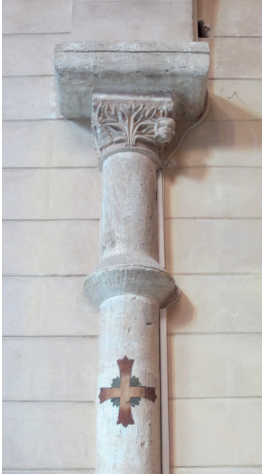
Fig. 1. Santa Maria la Real de Mallorca. Capitell i columna del segle XIII a l'actual església que originalment fou el refetor dels monjos entre els segles XIII i XVI.

La segona estança, el refetor, apareix esmentat l'any 1270 (Fig. 1) i del document se'n desprèn que l'edifici ja estava aixecat, encara que restava descobert (Mora; Adrinal, 1982: 315).