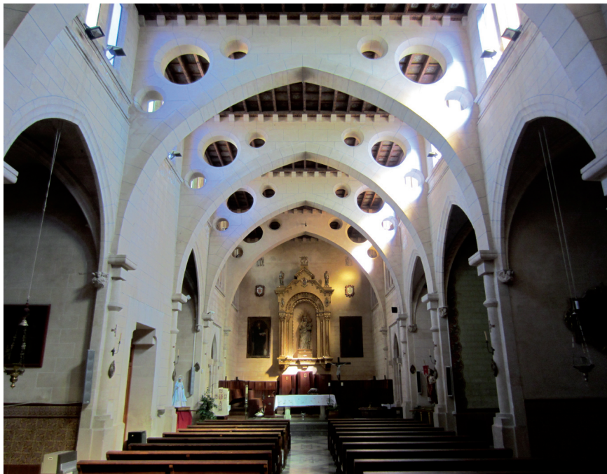
Fig. 6. Santa Maria la Real de Mallorca. Església actual.

Malgrat tot, és entre 1583 i 1616, durant l'abaciat de fra Onofre Pol, quan la documentació fa referència explícita a l'església monacal, la qual cosa ens fa pensar que tot i les restauracions dutes a terme per l'anterior abat, l'estat del monestir seguia sent deplorable, que amenaçava ruïna i que l'església estava a punt de quedar inservible (Munar M.SS.CC., 1935: 73). Fins a dia d'avui, els diferents historiadors que han parlat sobre el monestir, han escrit que fou l'abat Onofre Pol el qui restaurà l'església per tal que pogués seguir desenvolupant les seves funcions. Però, si tenim en compte les anomalies d'orientació i de localització abans esmentades, el més probable és que aquest abat no restaurà l'antiga església del segle XIII, sinó que degut al mal estat de conservació de l'edifici, aquest no es pogués salvar i es prengué la decisió de convertir l'antic refector dels monjos, documentat el 1270 (Mora; Adrinal, 1982: 315), en l'església abacial. Seguidament es decidí engrandir l'edifici amb dues capelles, la de Sant Onofre i la del Sant Crist dels Monjos. D'aquesta manera s'explicaria l'actual situació i orientació anòmala del temple cistercenc mallorquí.