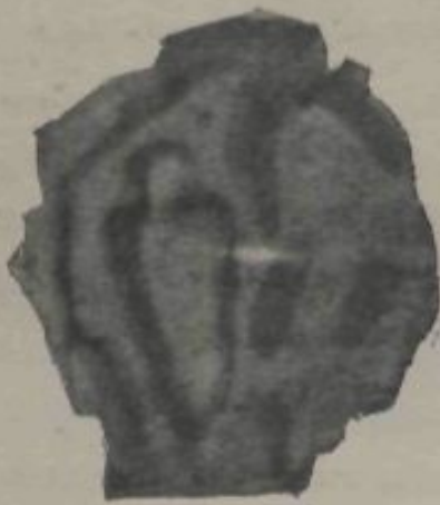
OLÉRDULA.—SELPULTURA OBERTA EN LA ROCA.

En lo cementiri que envolta la esglesia 's notan distints buyts, en que per la forma del cos y del cap humá entretallada en la pedra indican esser antigüas sepulturas. Tenen ademés marcats los encaixos pera ajustarhi las llosas que 'ls cobririan. Un d'ells estava tapat ab sa corresponent llosa, lo que 'ns induhi á creure que inclouria, tal volta, encara restos humans. Se troban varias d'aquestas sepulturas escampadas en distints punts de la montanya y 'n vegerem