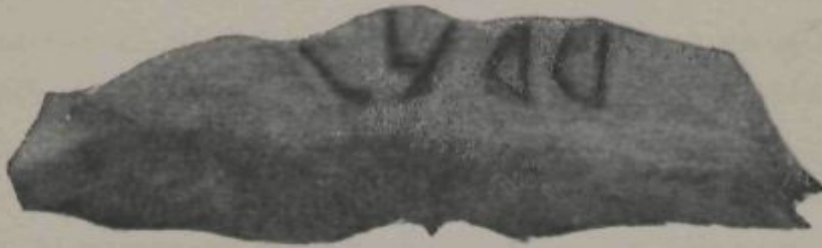
OLÉRDULA.—FRAGMENT DE UNA ANTIGUA INSCRIPCIÓ GRABADA EN LA ROCA.

mentres en altres està empleada la obra cuita. Es en extrem imponent y grandios aquest resto de muralla y fa presentir tot seguit la convicció d' esser despulla d' un gran sistema de fortificació, pera guardar lo territori que circunda. Tant la primitiva construcció d' eixa muralla com las distintas curiosas antigüetats que 's tróban en tots aquells envoltants, d'