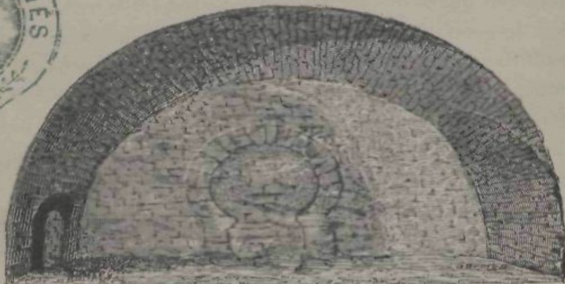
OLÉRDULA.—PORTAL EN LA ESGLESIA DE SANT MIQUEL.

Dibuix de D. Frederich J. Garriga, de un croquis de D. Eudalt Canibell.