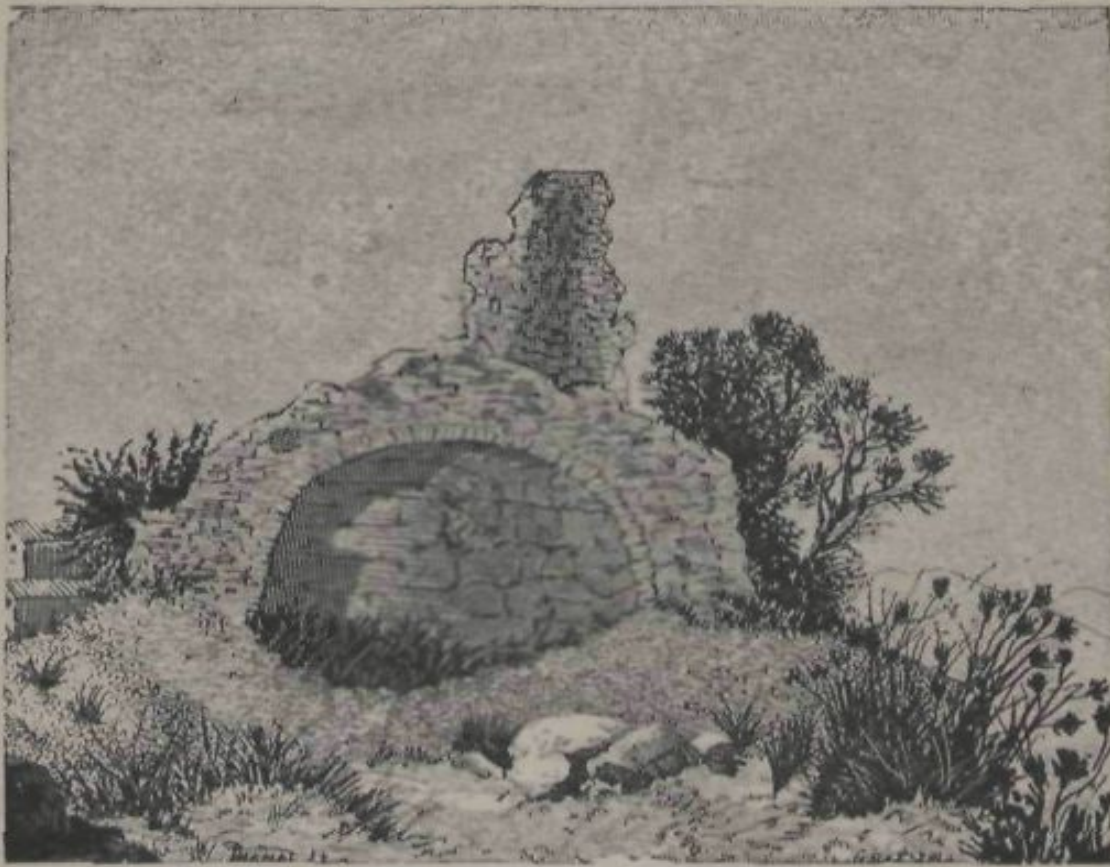
OLÉRDULA.—RUINAS DEL CASTELL.

hi notan impresions bastant notables especialment de petxinas. Procedent d' allí guarda una persona de Vilafranca