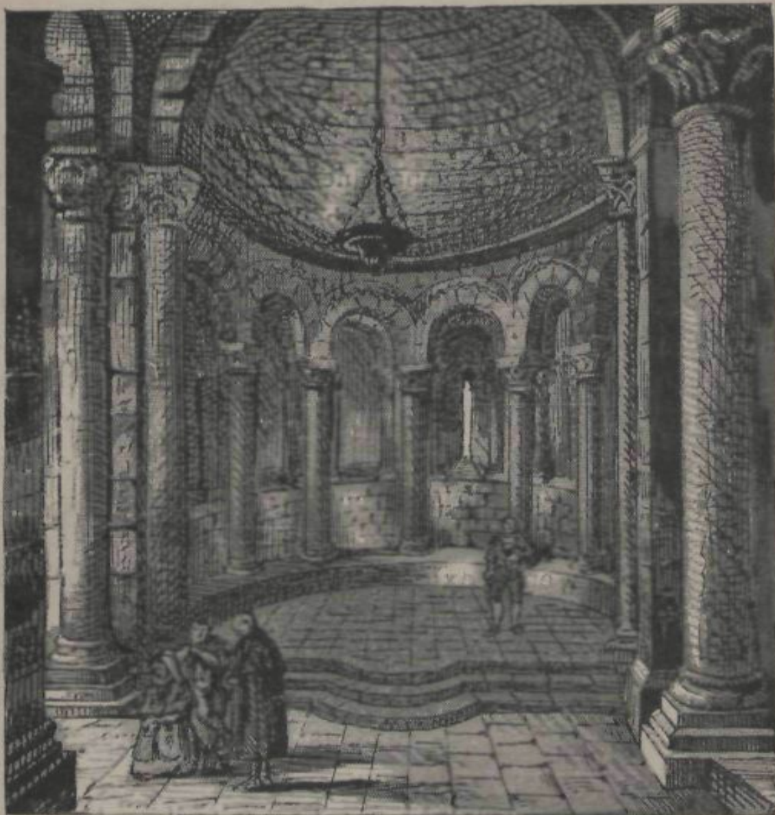
SANT MARTÍ SARROCA.—INTERIOR DEL ABSIDE DE LA ESGLESIA

Quasi bé enfront de la porta d'entrada de la esglesia està colcat, com per forsa, un retaule gòtic, de mitjà mérit,