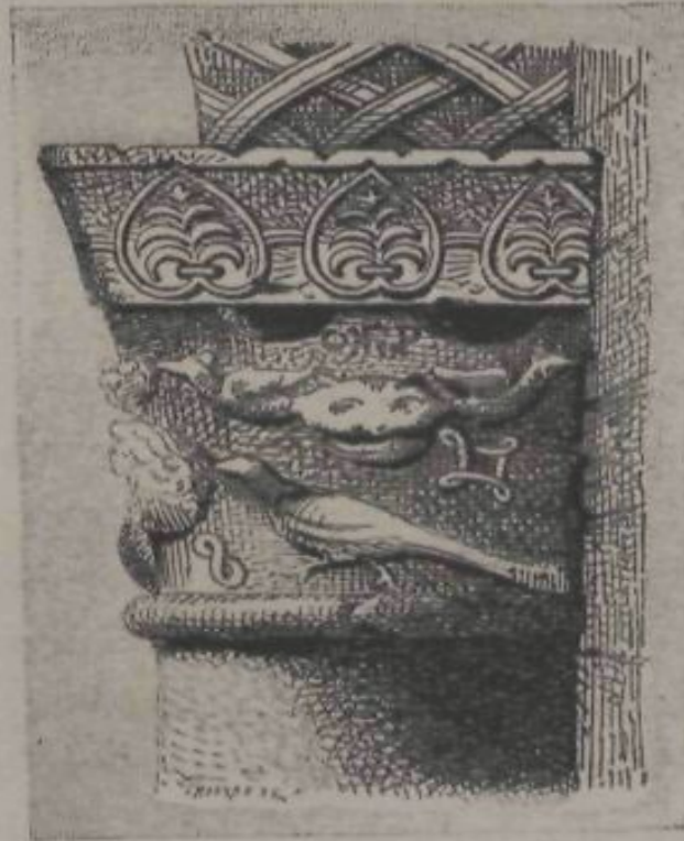
LA GARRIGA. — CAPITELL DE LA PORTADA DE LA ERMITA DE NTRA. SRA. DEL CAMÍ.

actual. La antigüetat de la construcció la demostra sobretot la entrada, y pera donarne una idea, vaig copiar los capitells, que es llástima no sigan igualment ben conservats, puix lo de la dreta, que es el que está més fet malbé, té en lo plinto