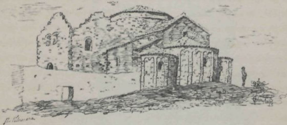
SANT LLORENS DEL MUNT.—MONASTIR.

cadena gegantina cap á ponent fins á pérdre's al lluny en mitj de boyras; més aprop, las pintorescas montanyas d' Olot, y més encara, lo vell Montseny, sempre cellut y amenassador ; á la dreta los coneguts turons de la ciutat comtal, que á son recés recolzada s' amaga á nostra vista, y per sobre d' ells la blava ratlla del mar, alegría de qui ha