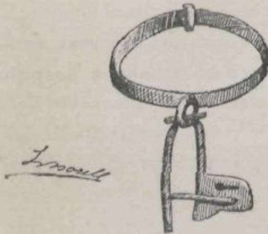
CASTELL DE SABASSONA.— ARGOLLA.

Fou aquesta una de las vistas que treguérem. Fou la altra un bell paisatge format per una petita eminencia prop del castell, ahont la descuidada y esplendent vegetació, junt ab lo típich d'unas capritxosas y despresas rocas, está realsat per una poética capelleta bisantina que en lo més alt s'aixeca.