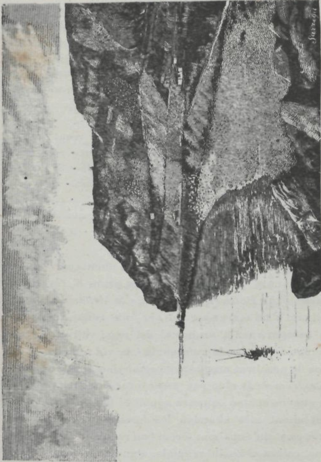
MONTANYA DE MONTJUICH.—VISTA DE LAS PEDRERAS.

Dibuix de D. F. J. Garriga, d'una fotografia de D. A. Massó.