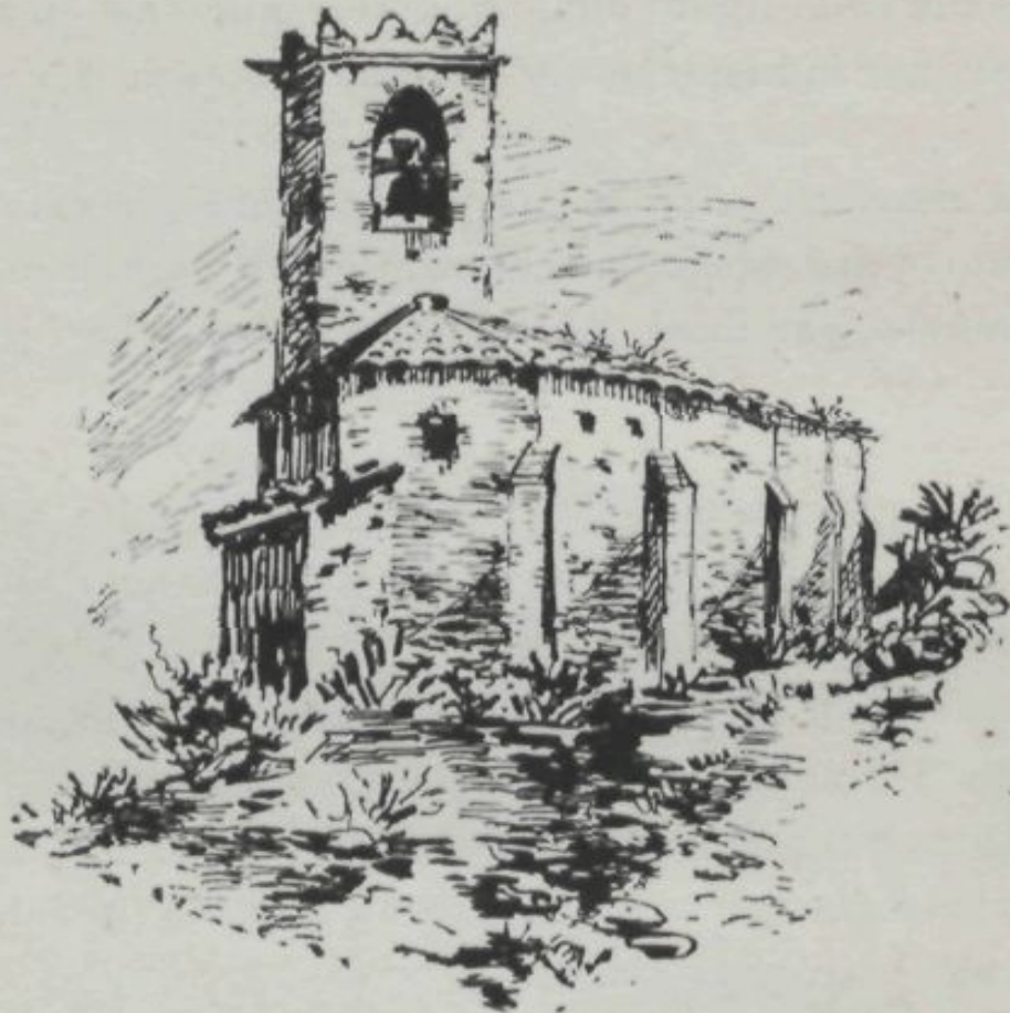
S. JUST DESVERN.—IGLESIA.

es essencialment agrícola, essent sas produccions mes especials la vinya, l' atmeller y la hortalissa, que allí s' conreuha pera donar abast al consum dels mercats de Barcelona.