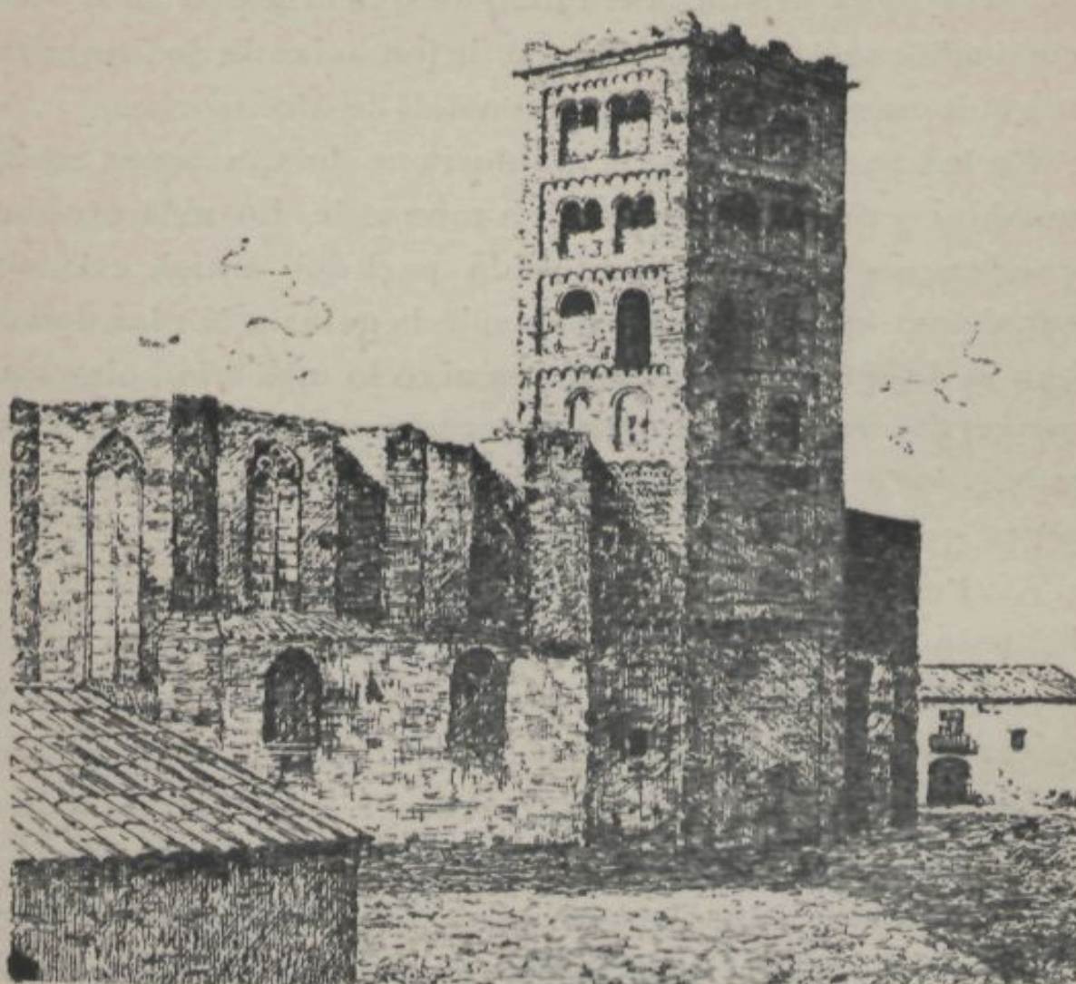
BREDA.—ABSIDE Y CAMPANAR DEL MONASTIR DE S. SALVADOR. Dibuix de D. Ramon Vergés.

son escrupulós treball y de notable interés per los trajos en que las figuras están representadas. L' altar major, de construcció moderna, no mereix menció especial.