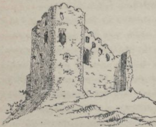
LA ROCA.—RUINAS DEL CASTELL.

Lo principal atractiu que té 'l poble pera l' visitant es lo castell, que s'alsa damunt seu, dominant una extensa y bella encontrada. Sens dupte reedificació d'altre més antich, ja que 'l punt ahont está situat es verament apropiat, es, segons deduhim, de construcció de principis del segle xv, com se deixa compendre per la perfecta conservació dels