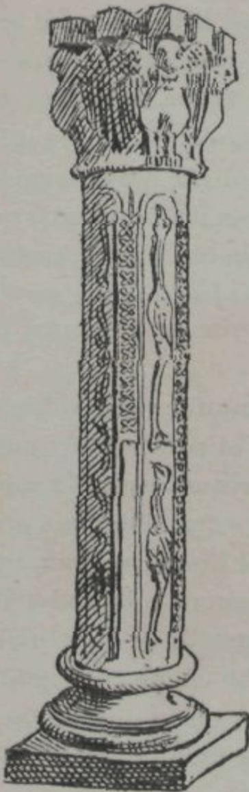
CASTELLET.—FUST D' UNA COLUMNA EN LO ATRI DE LA IGLESIA.

trias adornadas ab estrany bestiari y flors, executat ab molt art. Las basas de las columnas son áticas, no degene-