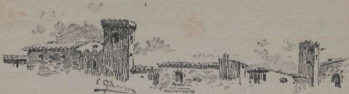
Carrer de Castelldefels.