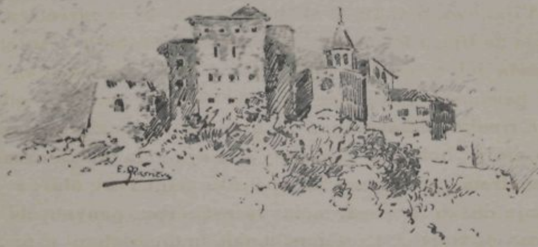
CASTELLDEFELS.—CASAL É IGLESIA.