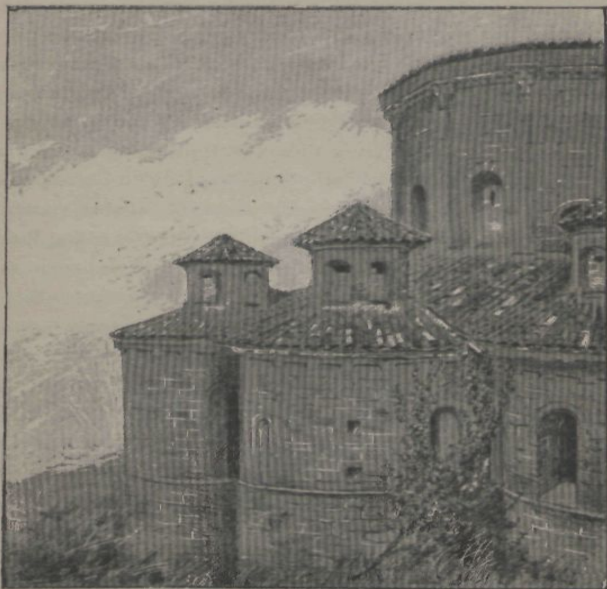
MONASTIR DE POBLET.—ABSIDE DE LA IGLESIA.

gráfic que 's doná á llum, y per medi dels dibuixos de detalls y de fragments que 's reculliren.