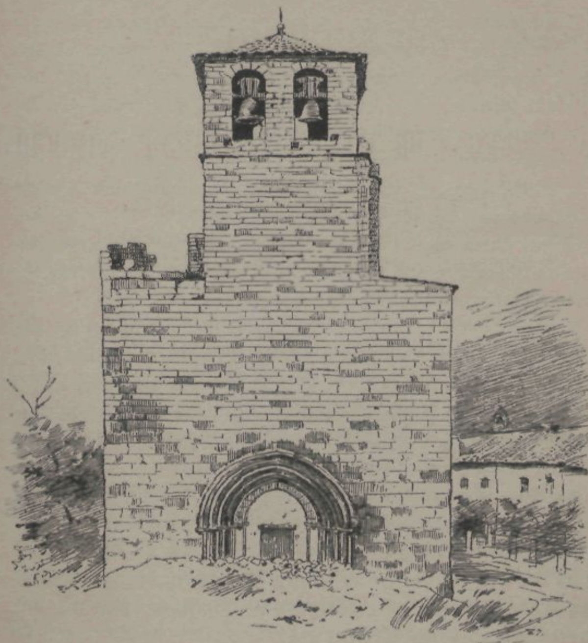
ESPLUGA DE FRANCOLÍ.—FATXADA DE LA IGLESIA VELLA.