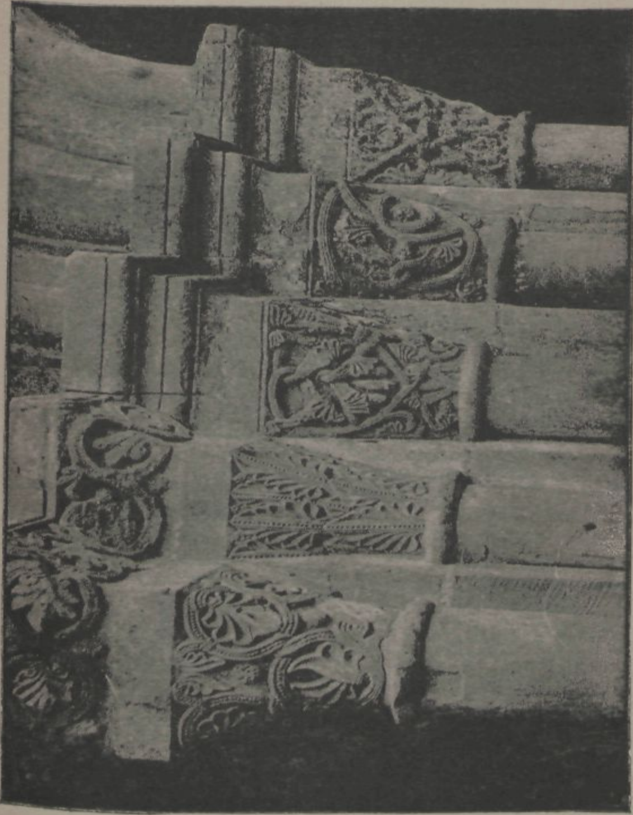
MONASTIR DE POBLET.—CAPITELLS DEL CLAUSTRE