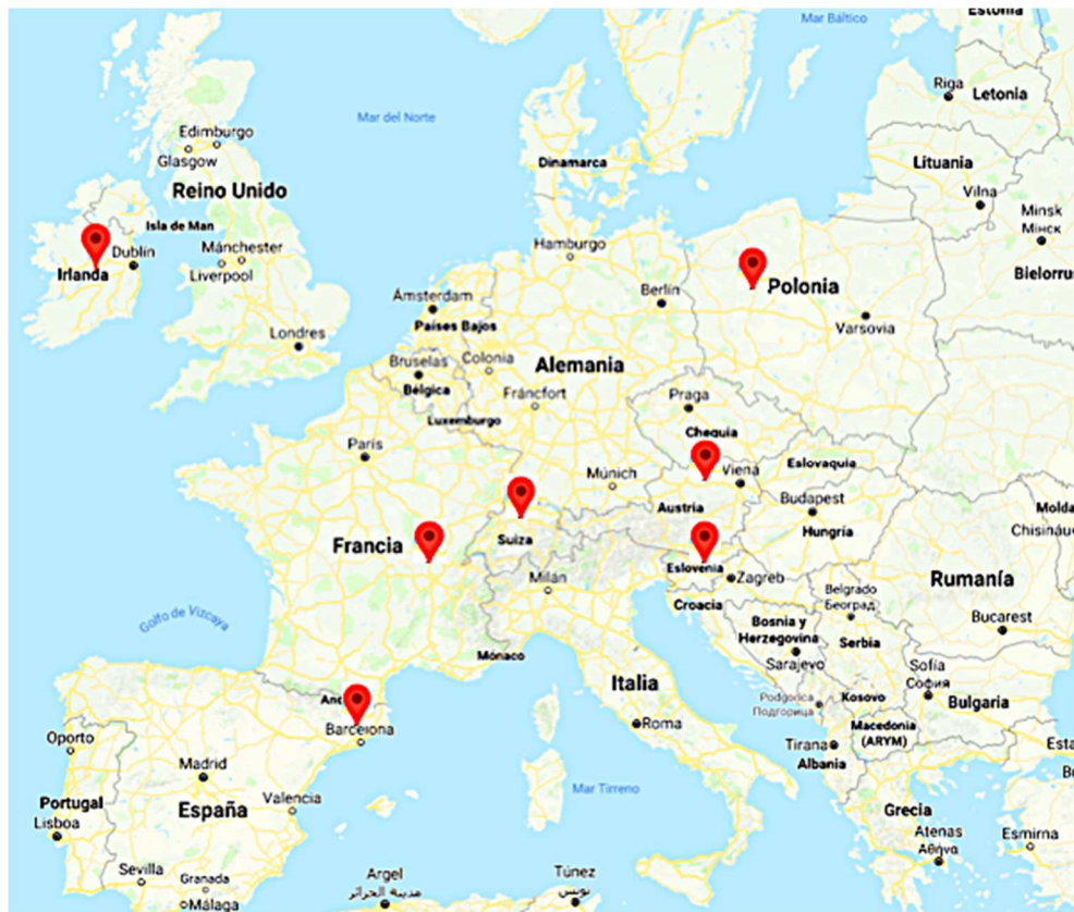
Ilustración 1. Situación geográfica de los miembros del consorcio.

La adecuación a los criterios internacionales está garantizada en este programa, debido a la participación de universidades europeas de referencia y de sólidas tradiciones antropológicas. Este es de hecho uno de los puntos fuertes de este programa, pues el máster implica un programa auténticamente europeo en toda su amplitud, aunando a grandes referentes en la tradición antropológica europea: la tradición de Europa central y la antropología alemana (U. Viena) – de gran relevancia en la Antropología europea pero escasamente abordada en España –, la tradición de la antropología francesa y su énfasis en la etnología (Lyon II); la tradición británica, con su énfasis en la etnografía, la teoría antropológica, los seminarios y la discusión (U. Ireland), la tradición del norte de Europa, donde destacamos la sistematización de la formación de máster en la estructura curricular y formativa (Bern); una muestra poco usual de la antropología desarrollada en el este de Europa (Ljubljana, Poznan) y, podríamos añadir, una tradición mediterránea (UAB). Al nivel gráfico, la representatividad de la Antropología europea es clara: