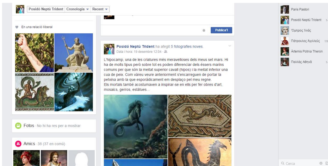
Fig. 4. Una de les publicacions de Posidó.

Un cop l'alumne ja ha reflexionat, cercat i emplenat tota la informació de la biografia del seu personatge i l'ha acompanyat de fotografies, imatges i/o vídeo, ha de demanar amistat a la resta. A continuació, ha de publicar al seu mur un petit escrit presentant-se en primera persona. A partir d'aquest moment, els estudiants han d'assumir a poc a poc el rol del personatge i començar a intervenir, de la manera més fidel possible, amb comentaris als companys. Simultàniament el docent l'afegeix al grup privat creat ad hoc .