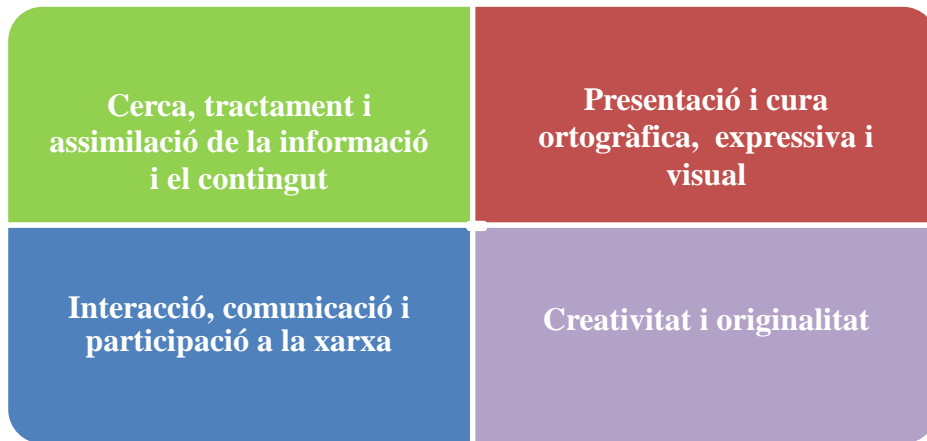
Fig. 10. Les dimensions i competències que s'avaluen agrupades en 4 grans blocs

Els grups s'avaluen per quatre graus d'assoliment i el conjunt de la rúbrica té una puntuació màxima de 100: excel·lent (100-90), notable (89-70), bé (69-51), suspès (49-0):