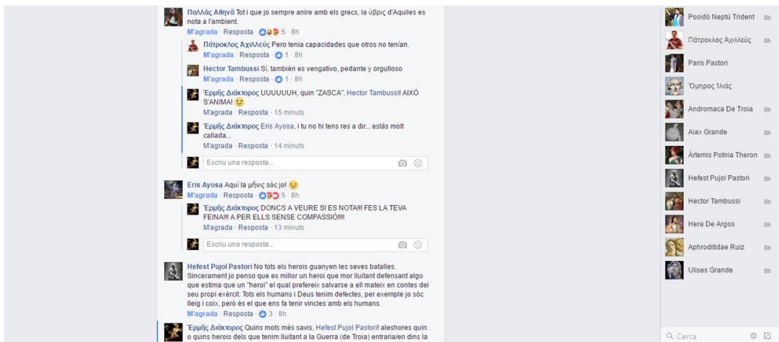
Fig. 7. Debat sobre el concepte 'heroi grec'.

Paral·lelament, treballem la figura de l'heroi grec i els valors de la societat homèrica, aprofitant també per introduir els següents conceptes: κλέος, μῆνις, τιμή, ὕβρις, ὄλβος, ἄριστος, ἀγαθός i ἐσθλός (Pòrtulas 2009, 44-48). El fragment de la trobada a l'Hades entre Odisseu i Aquil·les ( Odissea , XI, 476 ss.) pot ser molt útil per ajudar a entendre l'heroïcitat grega.