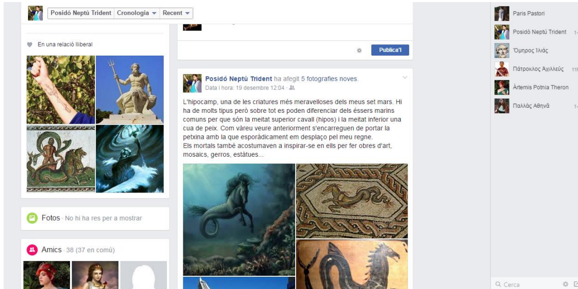
Fig. 2. El nostre grup privat, Oi 'Ομηρίδαι

Paral·lelament als perfils individuals, es crea un grup privat, en el qual s’hi agreguen els personatges, i que serveix de punt de trobada de tot i de tots. Des d’aquest, el professor, a través del seu rol, publica les tasques i les activitats que cal anar acomplint i controla el desenvolupament de l’acció.