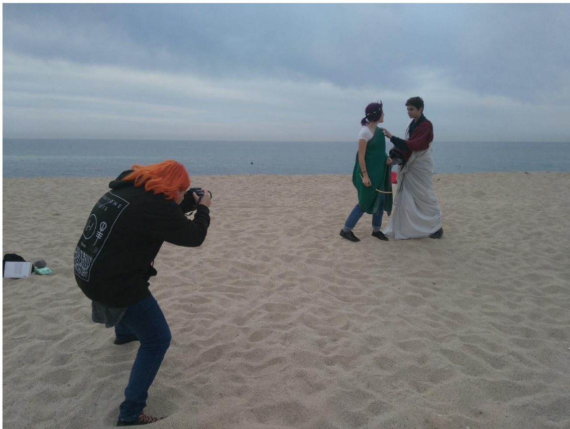
Fig. 8. Enregistrant una escena a la platja de Premià de Mar.

Els aqueus, per una banda, representen l'instant en què Pàtrocle demana les armes a Aquil·les i surt a lluitar ( Ilíada , XVI) i també el propi moment de la batalla des de l'òptica grega, quan Aquil·les mata Hèctor i després en malmet el cadàver ( Ilíada , XXII, 273 ss.). Per l'altra, els teucres interpreten el comiat d'Hèctor i Andròmaca ( Ilíada , 369 ss.), el combat ara des del punt de vista troià i la súplica de Príam a Aquil·les perquè que li retorni el cos del seu fill ( Ilíada , XXIV).