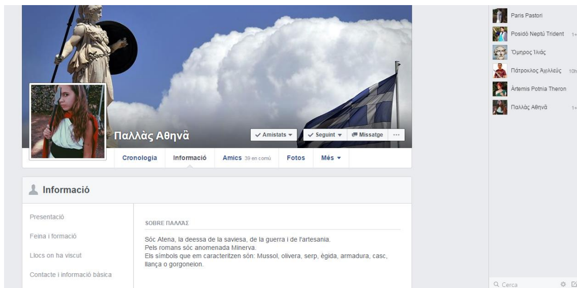
Fig. 1. Presentació del perfil del personatge d'Atena

Per la seva banda, el primer pas dels alumnes és reflexionar sobre el personatge triat i començar a familiaritzar-s'hi. La primera tasca, doncs, és la creació del perfil de Facebook, és a dir, emplenar tots els ítems de la biografia del perfil de l'usuari (nom, lloc de naixement, estat civil, ocupació, breu descripció biogràfica, etc.), així com l'elaboració d'un àlbum amb imatges d'aquest, dibuixos i/o selfies (disfressats o no). Un cop fet, ja es pot demanar la "petició d'amistat" 4 a la resta de personatges/companys i començar a interactuar assumint el rol del paper 5 .