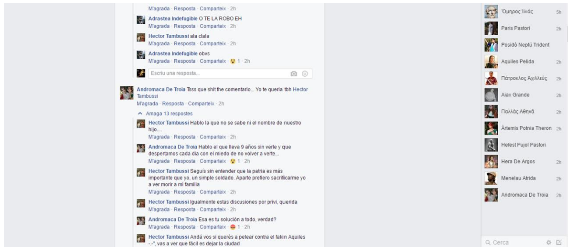
Fig. 9. Converses matrimoniales entre Hèctor i Andròmaca.