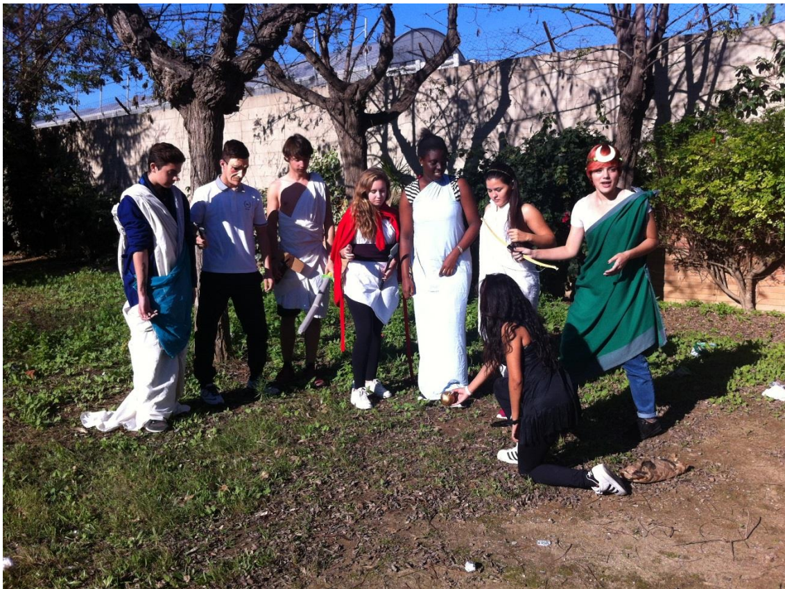
Fig. 5. Els alumnes disfressats dels seus personatges es fan fotos i enregistren un Mannequin Challenge

Finalment, es proposa el debat: Quina deessa creus que hagués triat el teu personatge? Per què?