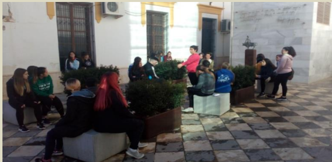
Imagen del 5 de diciembre de 2018, primera sesión de los Encuentros con los alumnos de 1º Bach. del IES Albujaia (Huércal-Overa).

En la Plaza Europa de Huércal-Overa, un recogido espacio entre la Casa Consistorial y el Teatro, y ante la escultura Homenaje a Europa (en la parte dcha. de la imagen) de la artista lorquina Lola Arcas, los alumnos exponen periódicamente (una salida cada dos UDD) los mitos seleccionados para el curso ante el resto de la clase. En la primera salida los alumnos seleccionados narran el mito y dan explicación a "El rapto de Europa" y "Medea y Jasón". A continuación, y ante la posible mirada y participación de los viandantes, tratamos entre todos a modo de debate-coloquio las implicaciones e influencias artísticas, culturales y sociales que han tenido ambos mitos en la posteridad. Esta actividad culmina con la presencia de la escultora que da una charla a los alumnos acerca de la manera de trabajar el bronce en el día precisamente de Europa, el 9 de mayo.