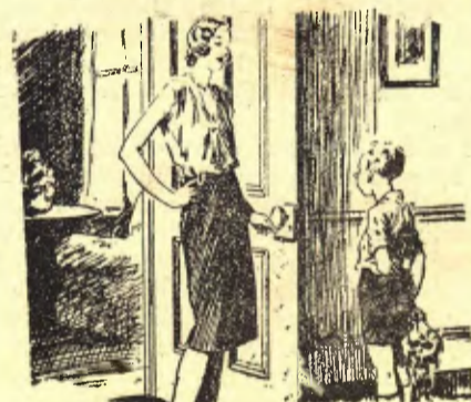
— Per què els volies, mamà, els ous que m'has fet anar a comprar? — Per fer una truita. — Ah!... està bé! (The Passing Show, Londres).