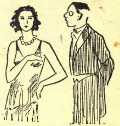
— Escolta, que et casaries amb un idiota; però que fos molt ric? — Per què m'ho preguntes? Que potser ets molt ric? (Dimanche illustré, París).