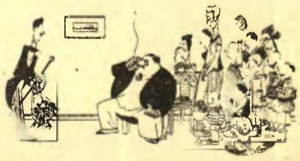
— Vinc a demanar la mà de la filla gran. — Està bé; ja us veieu capaç de mantenir una família? — Es clar... — Es que heu de pensar que som quinze! (Le Matin, París).