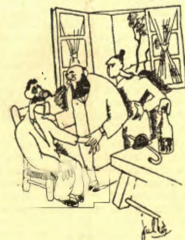
— Us hauríeu d'acostumar a beure més aigua que vi. — No sé pas si podré, doctor. Bec cinc porrons de vi cada dia... (L'Intransigent, París).