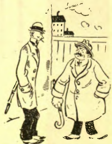
— Voleu dir que és tan difícil saber de comptar? — Parleu-me'n! El metge en va dir que només begués dos gots de vi cada dia, i sempre m'equivocava. (Moustique, Charleroi)

Subscriuiu-vos a MIRADOR SETMANARI CATALA Pelai, 62 - BARCELONA