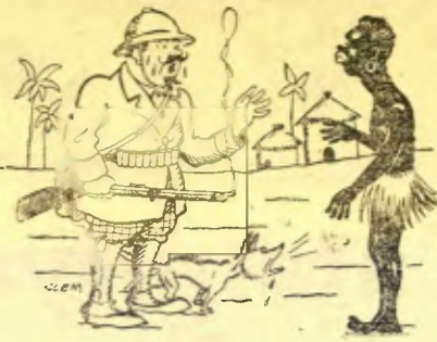
El caçador de Marsella.—Escolta, no has pas vist passar el lleó que acabo de matar? (Marius, Marsella)

Catarros, ronqueres, angines, laringitis, bronquitis, tuberculosi pulmonar, asma i totes les afeccions en general de la gola, bronquis i pulmons