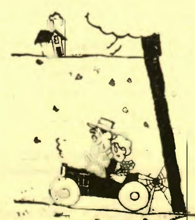
— No m'explico per què, estant engegat, el cotxe no arrenca. (L'Intransigent, París).