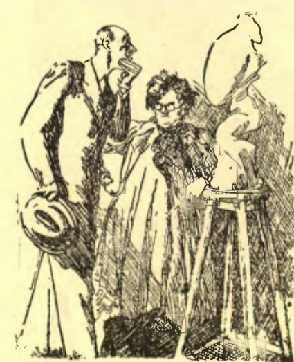
AVANTGUARDA — Espetrrant! I, digueu: a aquestes escultures els poseu el nom abans o després de fer-les? (Punch, Londres).