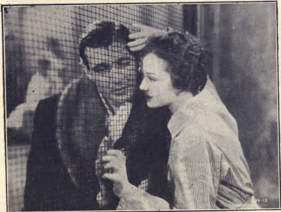
«Els carrers de la ciutat»

Antecedents? Cummings, Wellmann i Sternberg. Els tòpics habituals a l'ambient dels gangsters. Cinisme brutal, violència, sistema de gestos en tensió intermitent, pesant sensació d'angoixa, els retrobem aquí