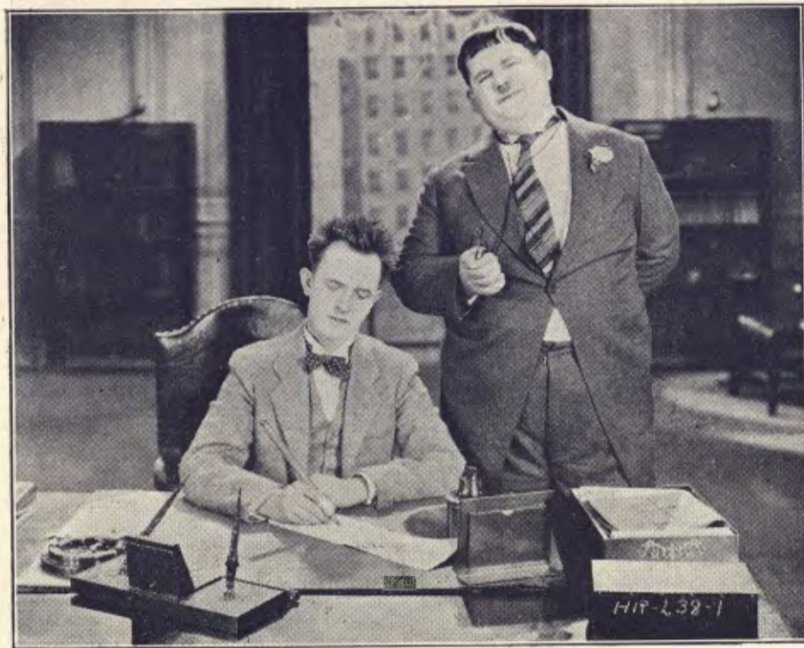
Stan Laurel i Oliver Hardy

L'adveniment del cinema parlat ha anul·lat molts valors. Molts actors, ortes de condicions fonogèniques, han hagut d'allunyar-se a un segon terme discret. A Laurel i Hardy, per contra, el parlat, si no els ha fet guanyar cap nova posició, no els ha fet