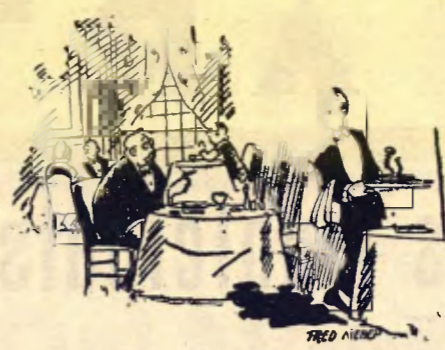
SEPARACIO DE PODERS

—Quina hora és? —Perdoni, no sóc jo el que serveixo aquestes taules.