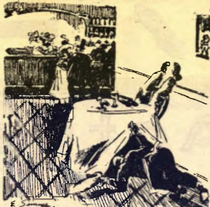
—Senyor: què li ha semblat el nostre nou cocktail?