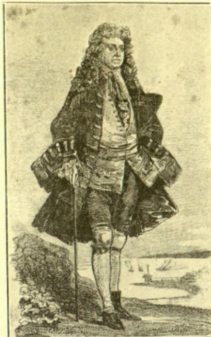
De Foe, per Dévénya

se de guanyar la vida escrivint. Debutà en les lletres amb projectes polítics i econòmics que cridaren l'atenció de la Cort fins a fer-li obtenir un empleu.