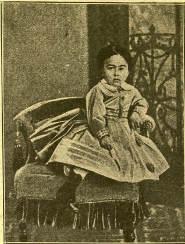
Benavente quan tenia tres anys

L'estrena de Pepa Doncel al Goya dona actualitat al teatre benaventí.