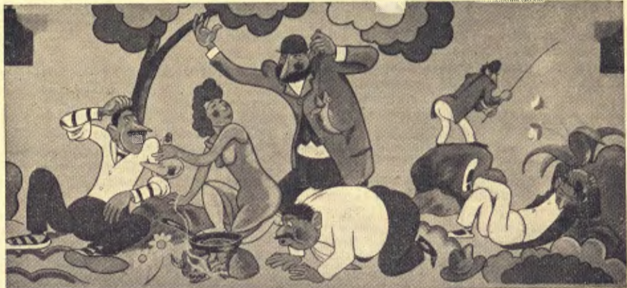
El dinar a fora

temps de materialisme. I l'últim bohemi ha sortit tan bona persona, tan innocent, que és pecat qui li fa mal.