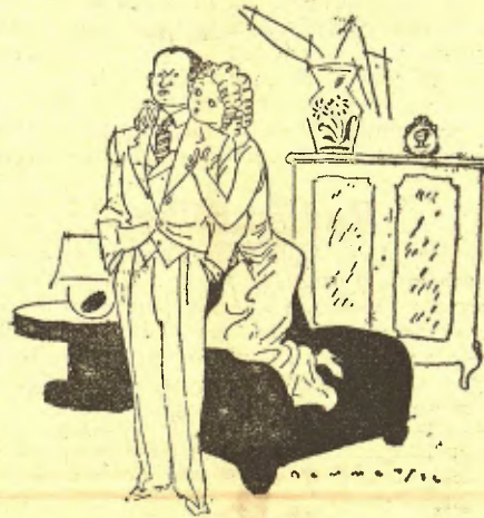
—No tens raó. El papà ja t'ha dit que anirà donant el dot a poc a poc. —Sí, però jo m'he casat amb tu d'un sol cop.