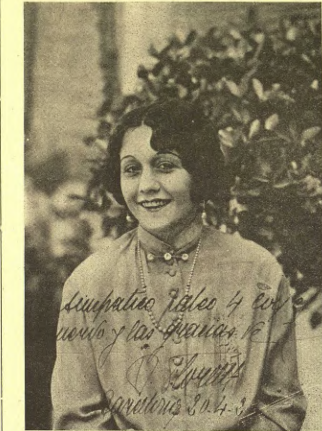
Una dedicatòria barcelonina de Florelle

l'acollida que esperava i que el seu art i el seu encís feien preveure.