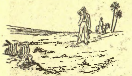
L'amant de la natura.— Això ja és massa! Fins en ple desert es troben restes de costelles!