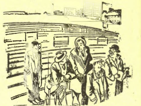
—Em va dir idiota i miop. —I ara! Jo no us he notat mai cap defecte a la vista.