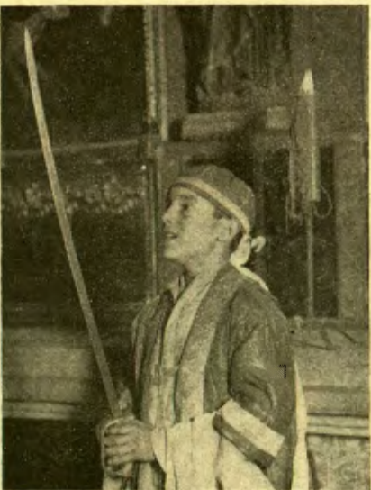
El cant de la cèlebre «Sibila mallorquina»

un dels centres principals de la vida musical mallorquina. I dos anys més tard funda una entitat coral que, després d'aquests tan pocs anys d'activitat, ja és comptada entre els millors orfeons d'Espanya.