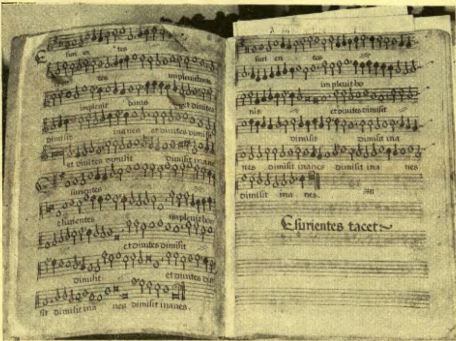
Un dels més rars manuscrits musicals de l'arxiu de la catedral: el «Magnificat» de Pau Villalonga

Sessions d'estudis i concert pel conjunt instrumental MUSICA PRO AMORE ARTIS