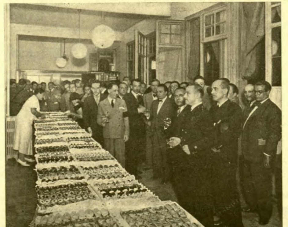
Les autoritats catalanes brindant per la radiodifusió catalana