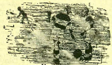
FUTBOL ENTRE LA BOIRA

Després, són les comèdies de Mac Sennett amb el seu equip de banyistes, entre les quals no sabem encara distingir — ni nosaltres, ni Mac Sennett — les que havien d'ésser anys després les primeres stars del cinema.