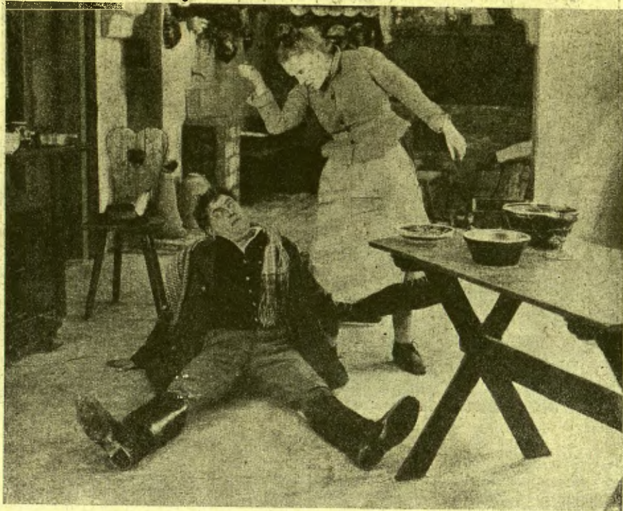
Un antic film còmic d'Emil Jannings

Tot això ho veureu ràpidament en aquest documental, molt hàbilment muntat a base de preciosos fragments extrets dels arxius cinematogràfics americans. Creïeu-me, que és emocionant.