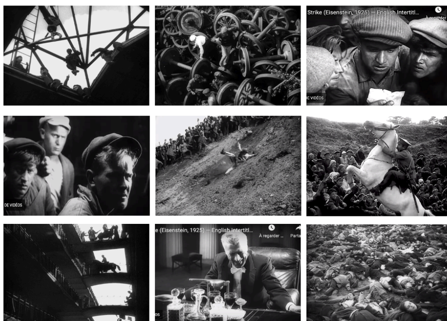
Statchka (fotos 1-9)

Fuente: Fotogramas de la película Statchka (1925) (Dir S. M. Eizenštein).