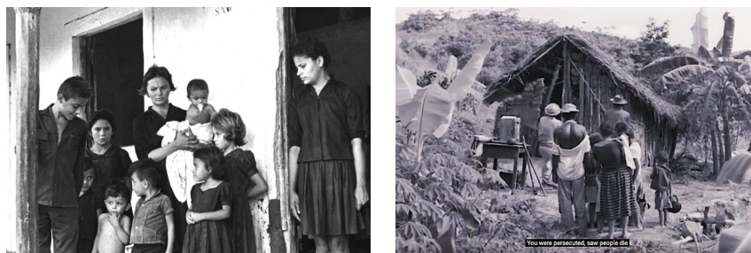
Cabra (fotos 1-2)