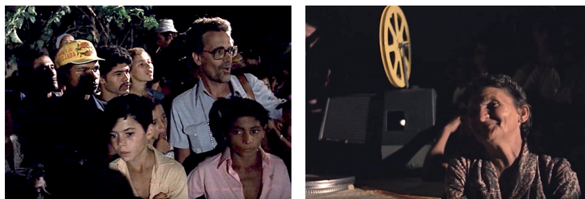
Cabra (fotos 3-4)