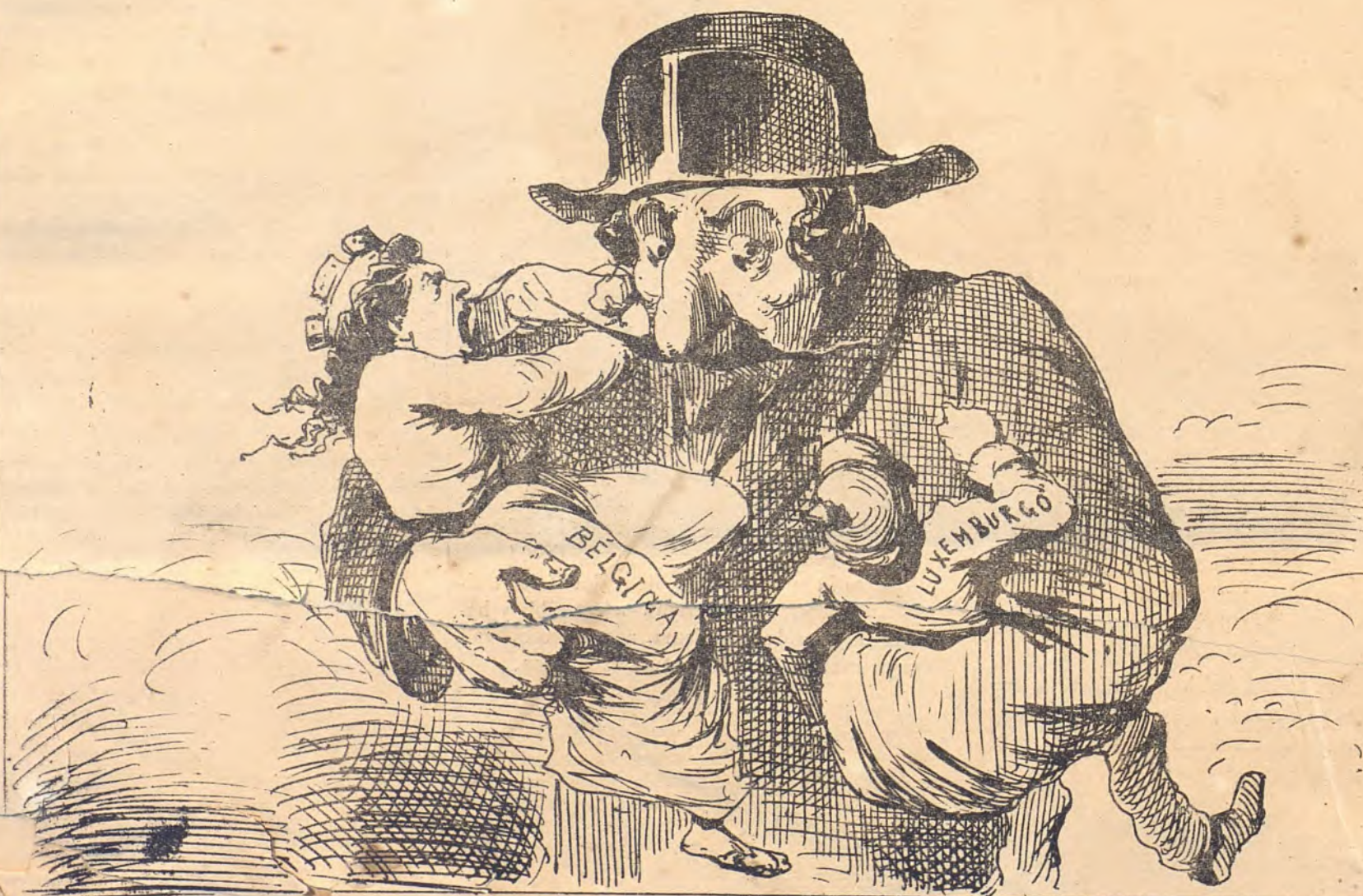
Lo que quiere la Francia.