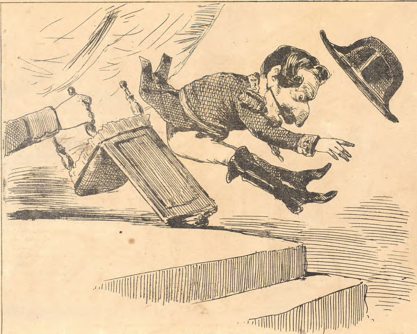
Lo que quiere la Prusia.