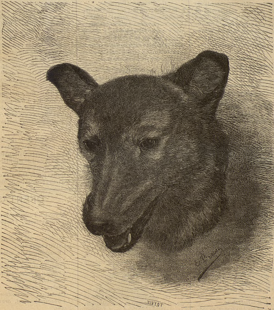
HÍBRIDO DE LOBO Y PERRO.

En Mónaco los tiros de pichon están concurridísimos