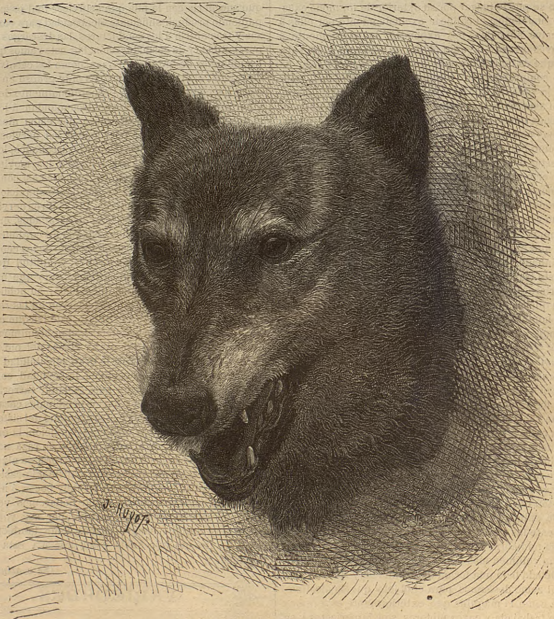
HIBRIDO DE LOBO Y PERRO.