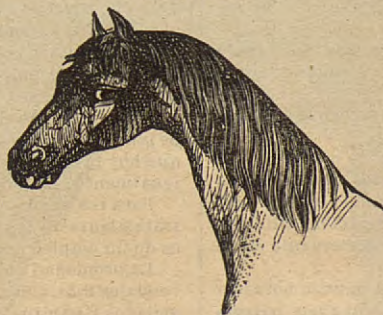
Lámina de grandes dimensiones compuesta de más de 80 grabados que representan todas las bellezas, defectos y enfermedades del caballo, siendo por lo tanto muy útil para los veterinarios y aficionados á aquel animal.

Se vende á 6 reales ejemplar en la Administracion de este periódico, calle de Jaime I, 11, Barcelona.