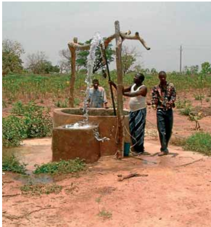
Codesenvolupament. A la regió més empobrida del Senegal, l'Alta Casamance, s'ha impulsat el pla integral de desenvolupament rural promogut per associacions d'immigrants.