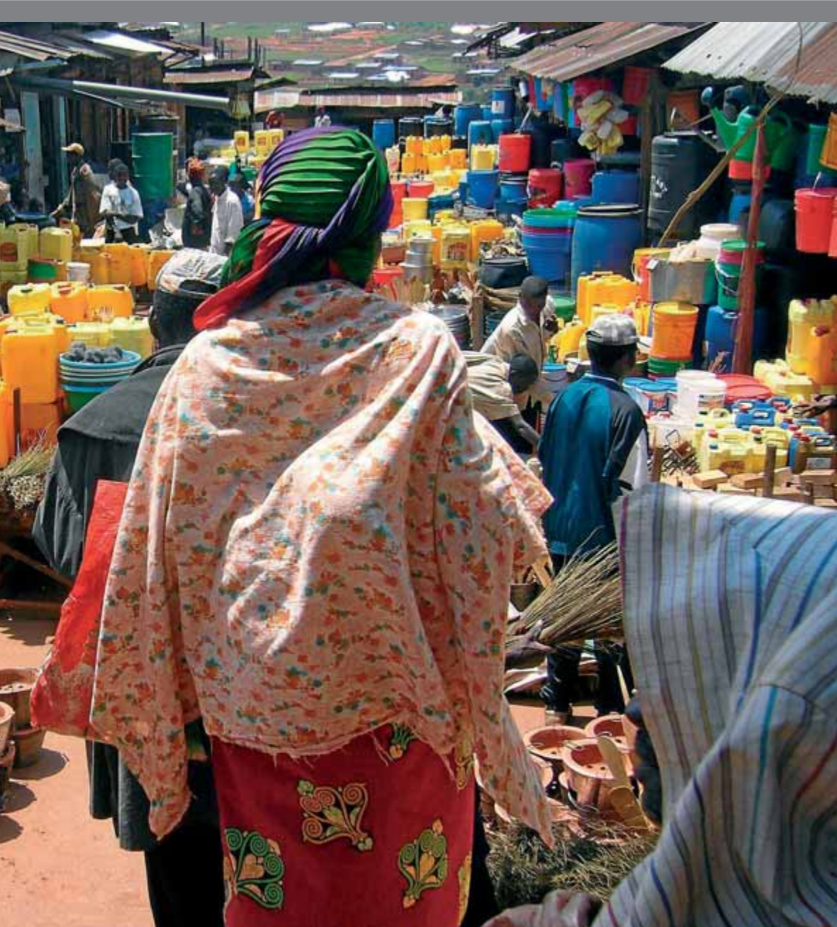
La cooperació catalana ha donat suport alimentari a la R.D. del Congo.

Fiscalitat Justa, Ambiental i Solidària. Qualsevol d'aquestes xifres és significativament més gran que el pressupost en cooperació de l'agència: 49 milions d'euros l'any 2010 i 22 milions l'any 2011. Finalment, que algú mori de fam a la banya d'Àfrica, no tingui accés a l'educació al Marroc o dormi entre cartrons a la plaça Catalunya són diferents conseqüències d'un mateix sistema econòmic, social i polític que perpetua la desigualtat i la injustícia.