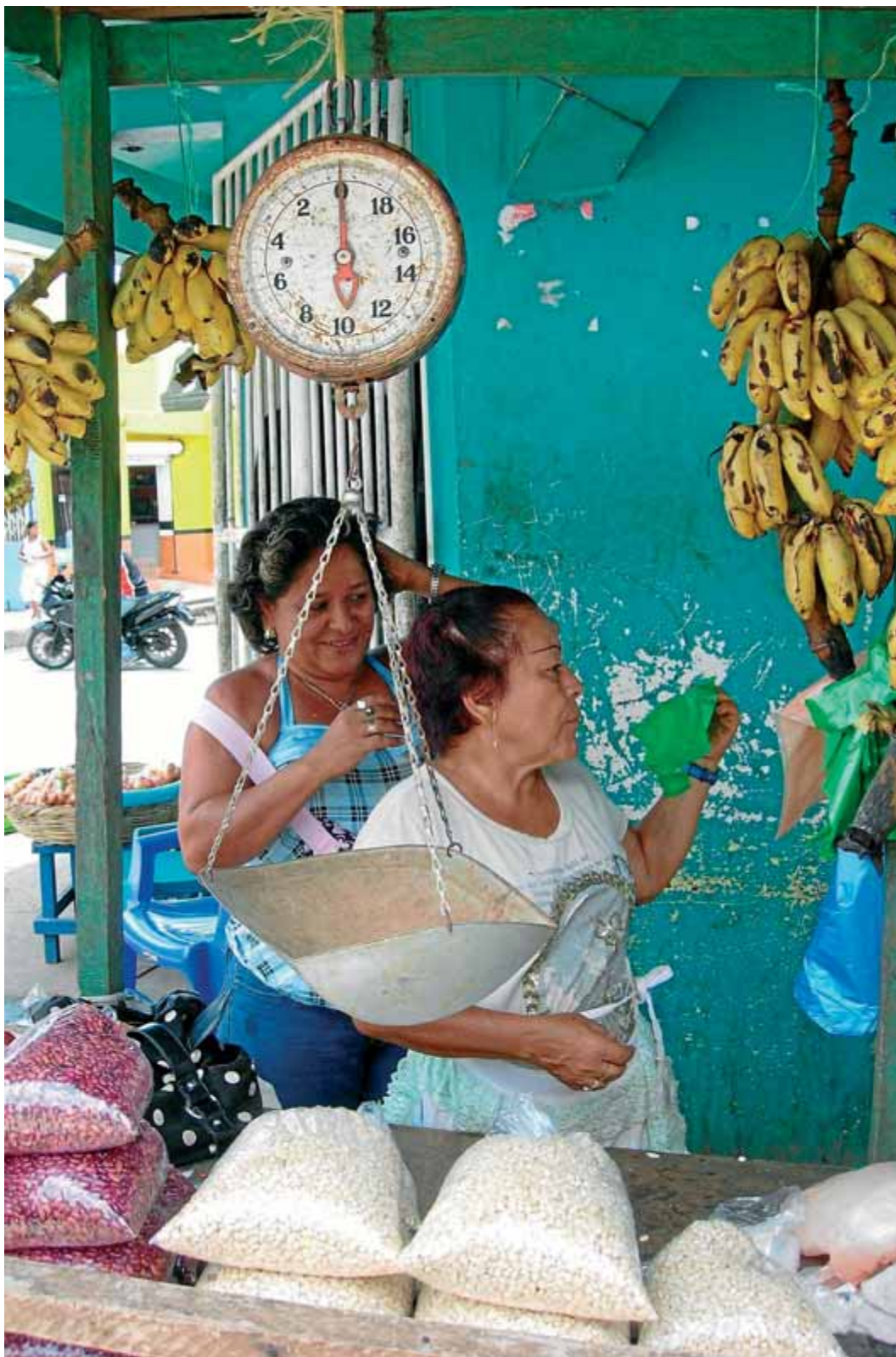
Parada del mercat de Bluefields. Nicaragua ha estat un país prioritari per a l'ACCD, que ha donat suport al cooperativisme, a l'alfabetització, a l'enfortiment de l'autonomia i a la governança local.

El sud continua existint. En el sud i en aquest nord que avança ara cap a nivells més alts de desigualtat. I la solidaritat també existeix i fa servei, mai en una sola direcció com bé saben les moltes entitats catalanes que des de fa anys han treballat i treballen en projectes de cooperació al desenvolupament. Aquestes imatges en són una petita mostra.