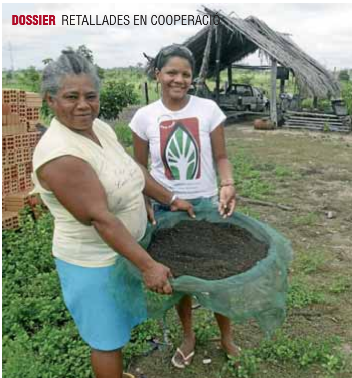
Dona, capacitat i democràcia. Es tracta d'un projecte d'Intermón/Oxfam amb finançament de l'ACCD que busca millorar les condicions de les dones a la regió nord-est del Brasil.