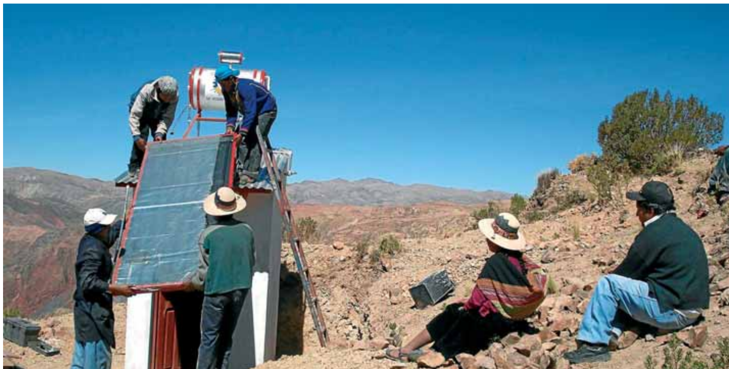
Millora de les capacitats productives. Segons l'Índex de Desenvolupament Humà del PNUD, Bolívia és el país d'Amèrica amb el nivell més alt de desigualtat social i econòmica. En la imatge, instal·lació d'una placa solar.