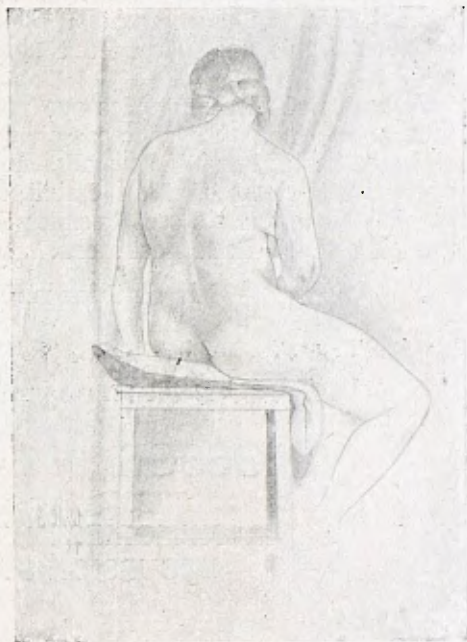
ACADEMIA, per Tomás Llobet

I nostre viure èpic? Mac l'aven donant la volta al món no dona lliçons d'audàcia a Elcano i als Argonautes? I aquests audaciosos que una i altra ve-