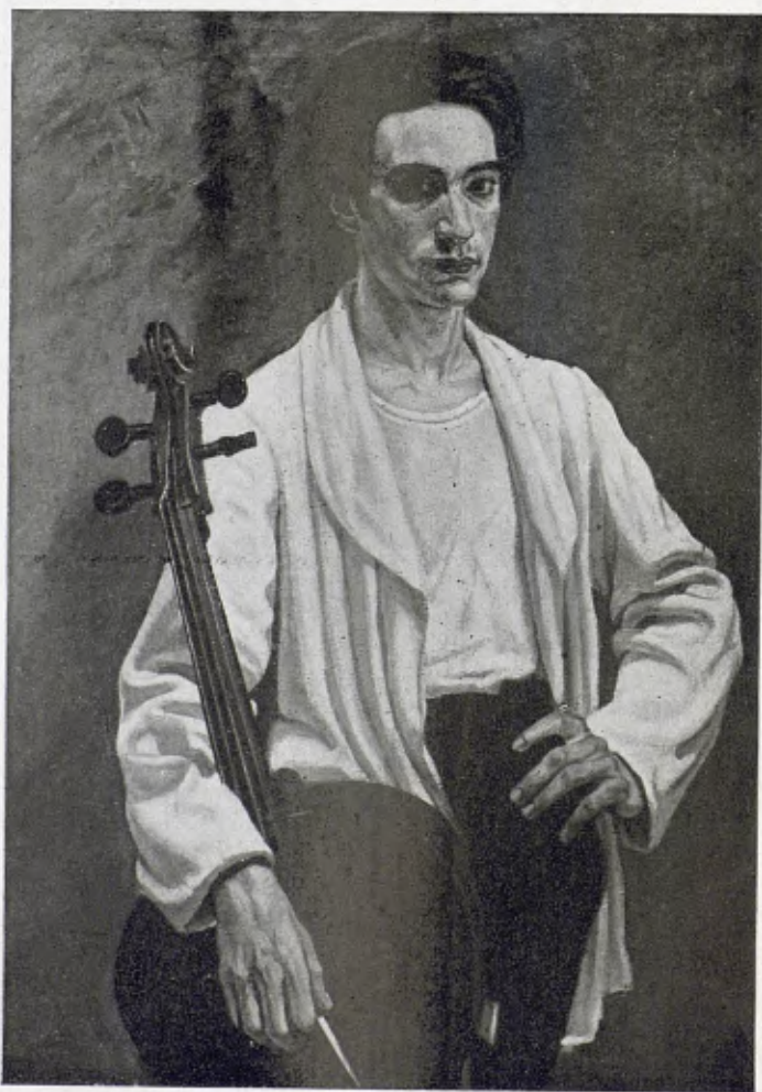
EL MEU GERMÀ VIOLONCEL·LISTA, per Sainz de la Maza

L'avantguardista es planta al mig del carrer, al mig de la via de carril, al mig