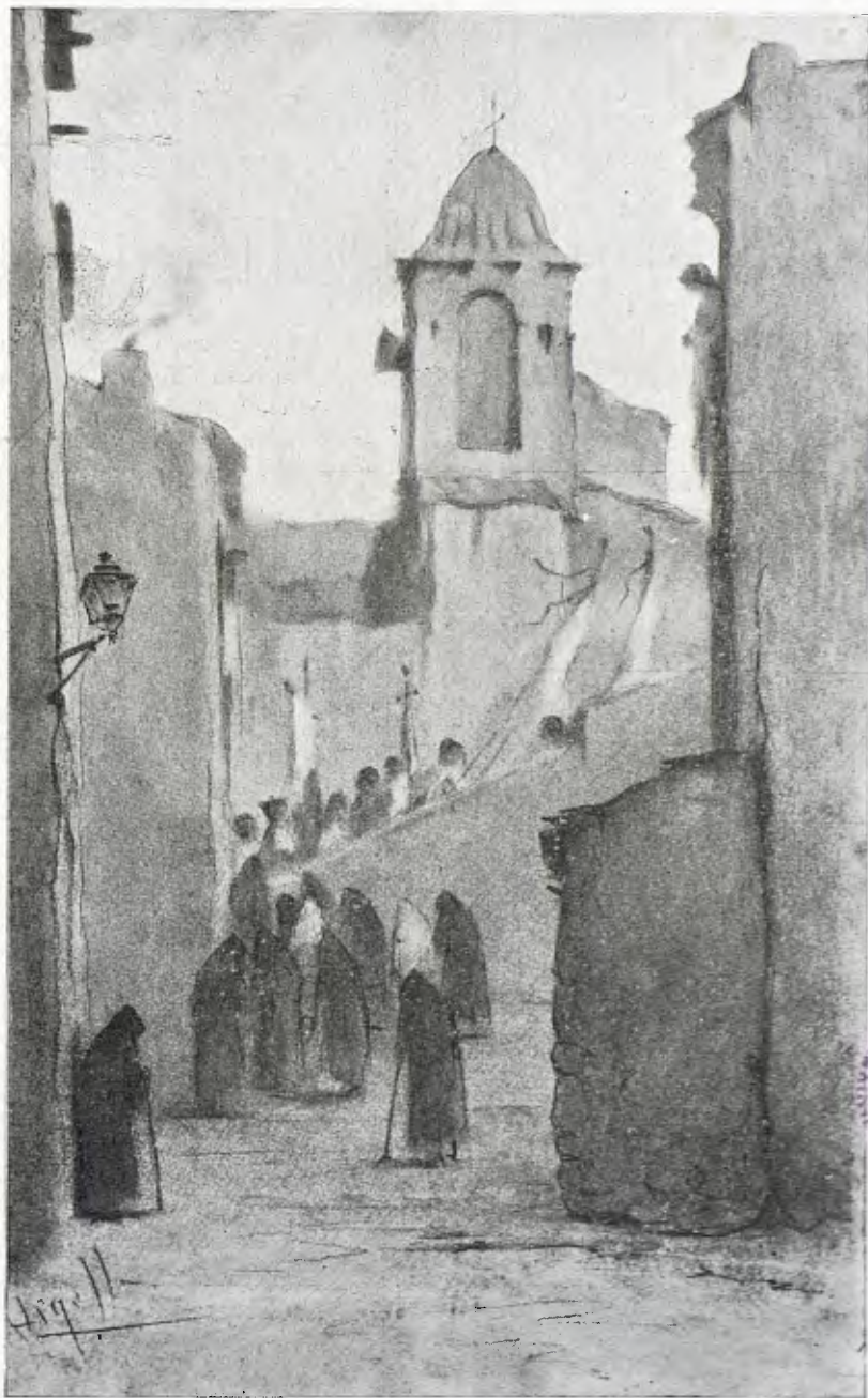
PROFESSÓ RURAL, per Modest Urgell.