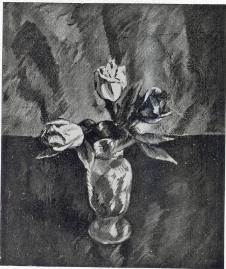
LES ROSES, per Antoni Roca

En Roca que pinta, dibuixa, escriu i llegeix contínuament, ha sabut arribar gloriosamen taels cims dels seus propòsits, i dia per dia, va produint i de-