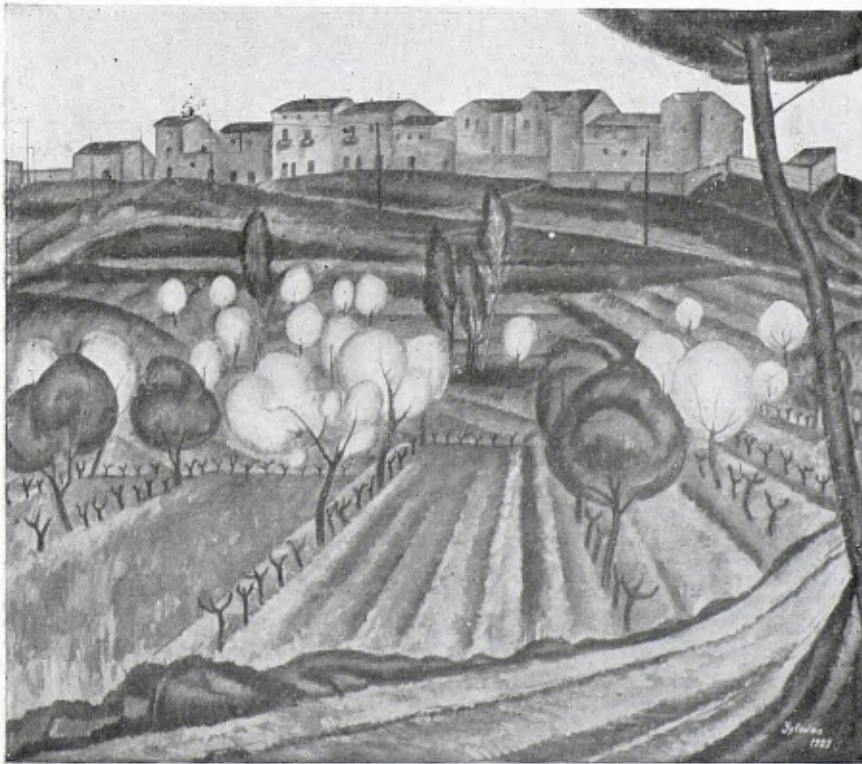
PAISATGE, per A. Iglesias