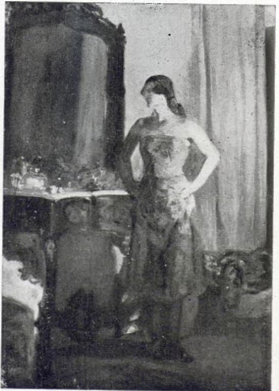
PINTURA, per Ricard Urgell

Hom ha decidit passar-hi la nit. A l'hostal, no quedaven disponibles altres cambres i hom ha tingut de dormir a la cambra de la filla de l'hostal—18 anys, riallera, plena, de cara rodona i rosada com un préssec—, la cambra acuradament ordenada, amb uns retrats, unes figuretes de guix, unes llaçades catalanes i unes flors de roba. El llit núbil, amb coixins de ploma, i amb llençols immaculats, ens ha estat com un breçol, on hi hem dormit com un infant que s'adorm a les cançons d'àngels que canten les mares, i ens hem despertat als cants també d'àngels, que cantaven unes nenes d'una colònia escolar, que han espargit l'alegria del viure, per aquell poblet silenciós.