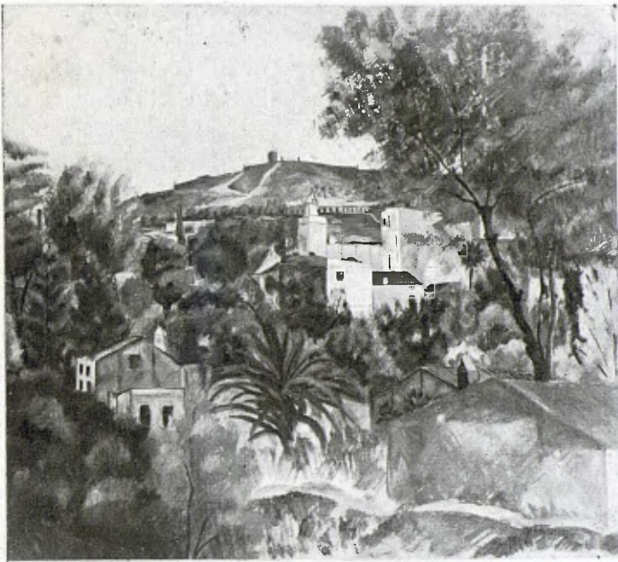
PAISATGE, per Tomás Llobet

unes construccions d'una modernitat carrinclona, aquells trossets de terra que cultivaven amb tant amor un cop sortits de les fàbriques els obrers, avui són una pestilent barracòpolis vergonya dels barcelonins.