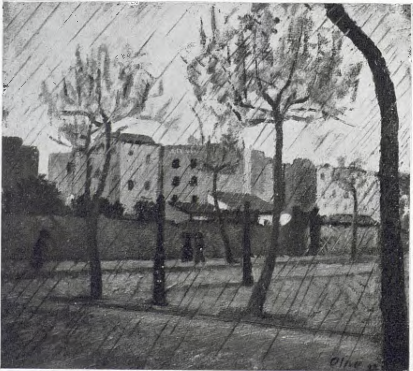
DIA DE PLUJA, per Jascint Olivé.

La terra s'ha remogut, aquells camps que vèiem plantar i desplantar continuament, avui no són més que uns pilots de fang, les cases belles que havien aixecat els nostres avis, han fet lloc a