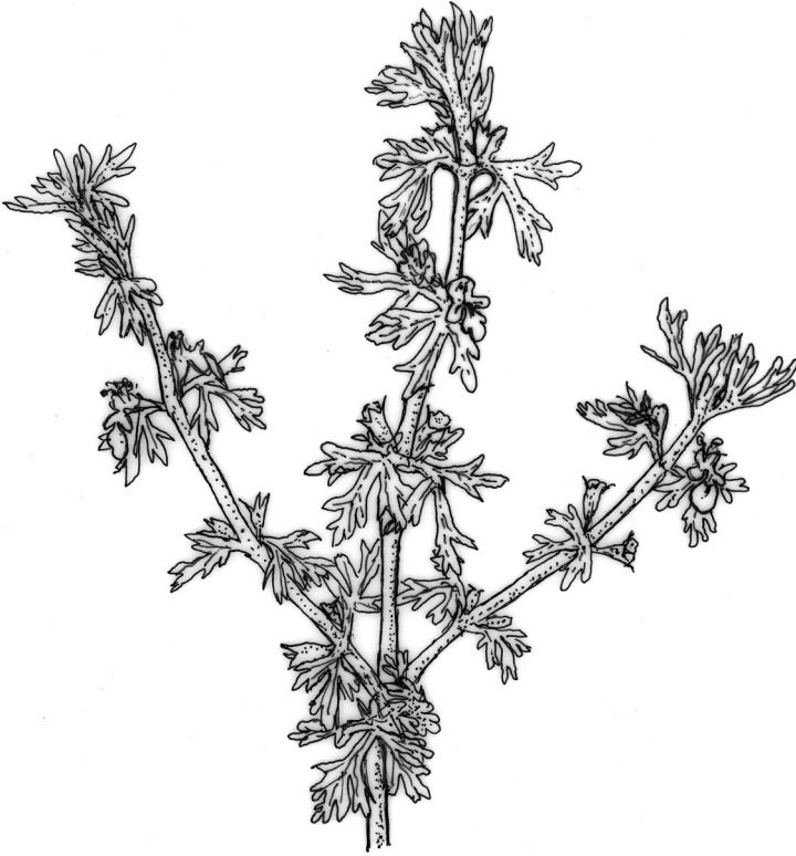
Figura 1. Aspecte general de Teucrium campanulatum .