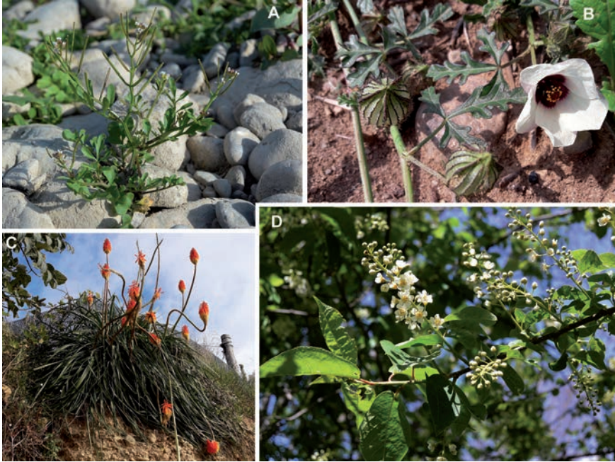
Figura 2. A: Cardamine occulta ; B: Hibiscus trionum ; C: Kniphofia praecox ; D: Prunus virginiana , flors i fulles.

lògica i, d'altra banda, les descripcions disponibles a la bibliografia és freqüent que no siguin coincidents en els caràcters diagnòstics (Rosenbauer, 2011; Verloove & Sánchez Gullón, 2012; Bomble, 2014; Hepenstrick & Hoffer-Massard, 2014; Dirkse et al., 2015; Mansanet-Salvador et al., 2015). Nosaltres hem atribuït les poblacions indicades a C. occulta per la combinació d'un conjunt de caràcters que les diferencien de C. hirsuta o de C. flexuosa . No són referibles a C. hirsuta per caràcters com les flors amb 6 estams, els fruits no paral·lels a la tija, la tija molt flexuosa o l'absència d'una roseta basal clara. S'aparten de C. flexuosa pels folíols terminals trilobats, per l'anvers foliar glabre i per la mida curta (c. 5 mm) dels pedicels fructífers. Les nostres plantes —en especial les d'Oliana— tenen sovint les tiges força piloses, mentre que en gran part de la bibliografia es diu que té les tiges glabres, però ja fa temps que es va assenyalar que en les poblacions del llac Constança la pilositat caulinar de C. occulta és variable (Bleeker et al., 2007).