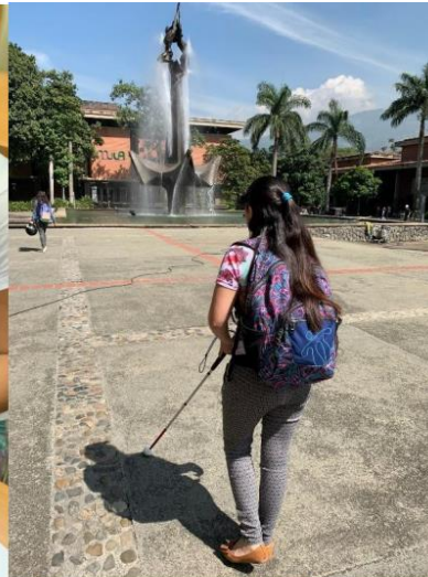
Orientación y movilidad, 2019

De otro lado, entre 2014 y 2018 se graduaron 57 estudiantes con discapacidad y 123 abandonaron estudios de pregrado. Estos últimos, están concentrados en los estudiantes con baja visión (55%), seguidos de los estudiantes con discapacidad en miembros superiores (15%) e hipoacusia (12%). Se resalta el alto número de desertores en las Facultades de Ingeniería, Ciencias Exactas y Ciencias Económicas y Educación, por el significativo número de estudiantes con baja visión que abandonan. El 63% de los estudiantes que desertan son del sexo masculino. Por áreas del conocimiento están concentrados en el área de Ciencias Exactas, Ingeniería y Economía (66 desertores), seguida de Ciencias Sociales (39) y del área de Ciencias de la Salud (18).