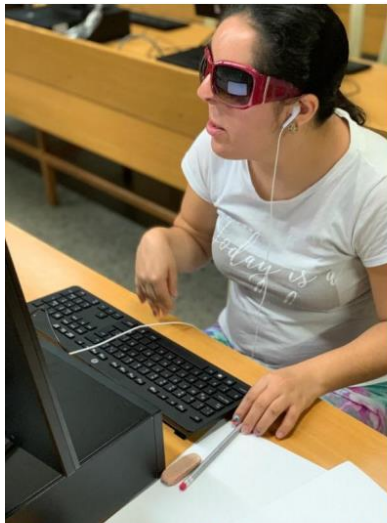
Simulacros examen de admisión, 2019