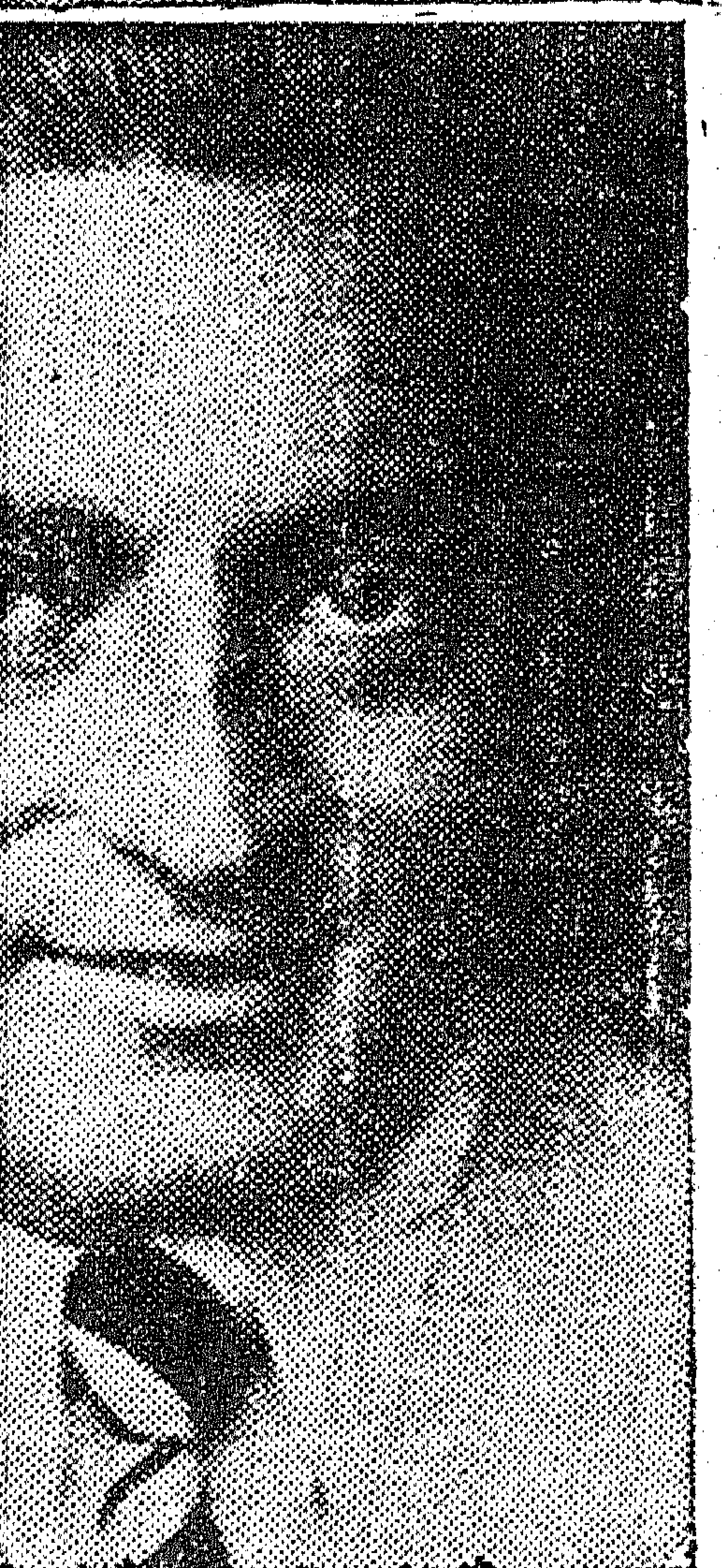
SIMBOLS CIES CONSAGRADES TALUNYA mpte. Macià. dia.

Consell la unitat sense excepció de tots els sectors antifeixistes sota les directives d'una política en la qual es mantingui i estructurin els avenços socials aconseguits i s'estimuli el ràpid ressorgiment de totes les fonts d'energia de Catalunya per a produir un aixecament nacional que permeti guanyar ràpidament la guerra.