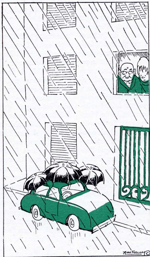
Veillant per la conservació del "600".