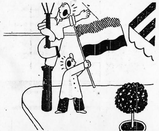
—Visca la Repúblicaana!!!