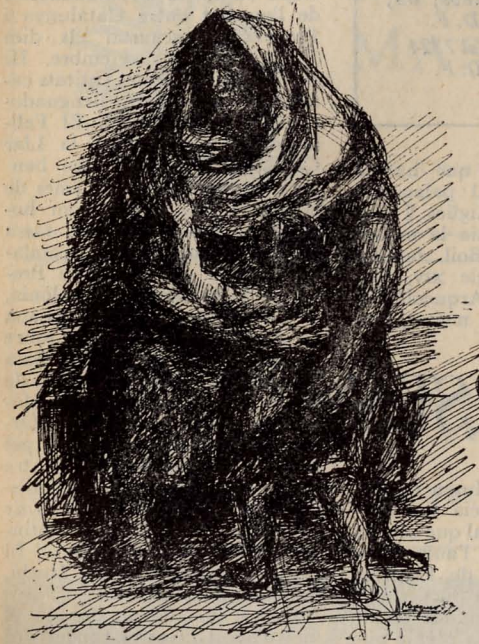
Dibuix de B. Messeguer (ploma).

Si és pogués donar un cas semblant, és gairebé segur que la màgia de Picasso no deixaria de funcionar: grim pant i relliscant, untuós, fent esforços per arrapar-se a una matèria escorredissa, el mateix Rafael potser tindria moments en els quals creuria que aquell, i només aquell, és el camí que pot recórrer l'artista sense por d'equivocar-se.— PERE CALDERS