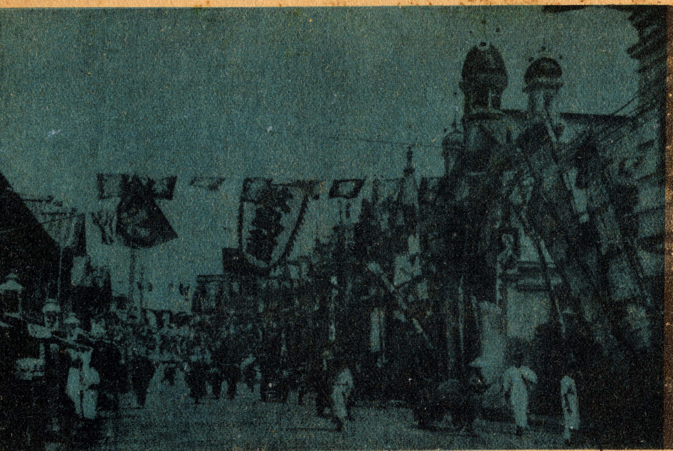
KOBE —CARRER DEL TEATRE

Allà encara no hi ha Comitè Econòmic i, malgrat tot, es veu que hi ha roba estesa i que han tret els drapets a relluir. Aquesta foto anàvem a llençar-la al cove, però, en veure que ja en venia, ens hem decidit a publicar-la.