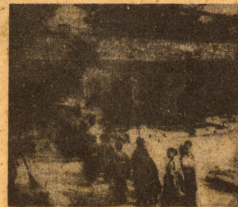
Les musmés estudiantils visitant un temple de Kioto dels que encara no han estat mai cremats, car a Kioto encara no hi ha hagut cap 19 de juliol, però potser no trigarà gaire.