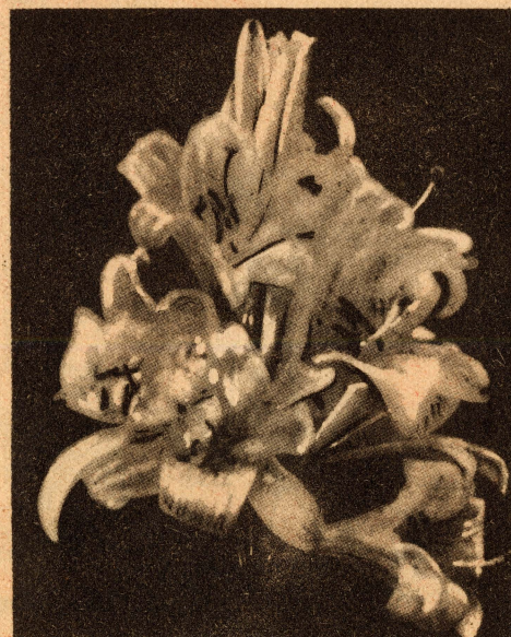
Lliri de Sant Antoni (Ara Tarrida del Màrmol)