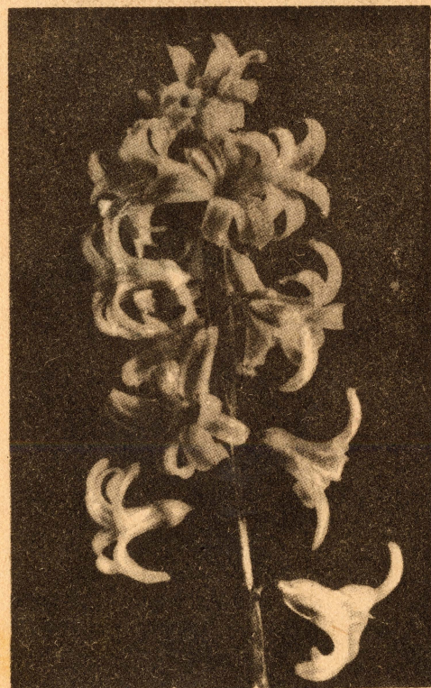
Un preciós «jacinto»... que no és aquell (1)

Nota bene. — Un altre dia, potser parlarem als nostres lectors de les flors de perfumeria, aplicació utilitària de les flors naturals i de les aplicacions de l'aroma de les flors al sabó. Cosa que, si Déu vol i ens don salut, prometem fer pel mateix preu.