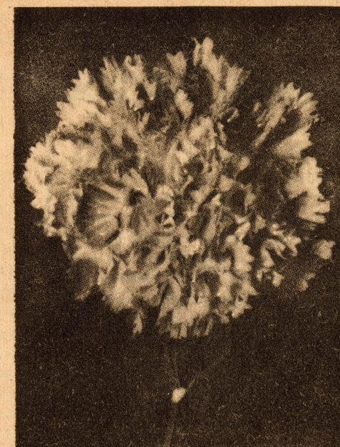
Un magnífic clavell «Malmaison» que està demanant a crits una orella

Però tornem al ram de les flors. La teoria de Shotako admet set línies representatives en les combinacions florals amb dibuixos de contorn inspirats no res menys que en la temptativa de representació de la naturalesa.