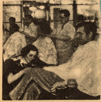
Clark Gable a la barberia!

Però no hi ha res que duri cent anys, com diu la dita, i un bon dia de la passada setmana inopinadament i sense proposar-se tal cosa un innocent xofer de taxi de Hollywood ha fet perdre a «Pamplinas» la fabulosa juguesca que en mala hora havia fet. No penséssiu que li féu pessigolles ni