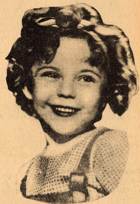
Shirley Temple, la precoç protagonista de «La petita coronela» que ens té el cor en un jai!

Reportatges, enquestes, mentides i veritats, per Pere Gallarí