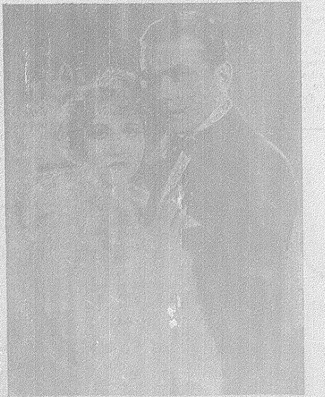
Richard Barthelmess i Betty Compson