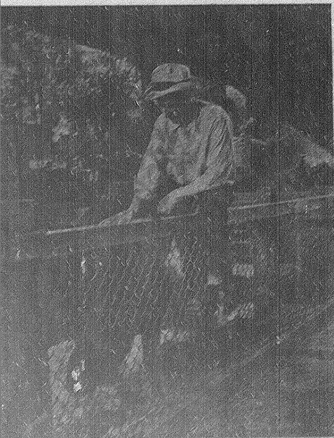
en una escena de "La fira de la vida"