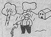
UN FILM DE NOIS