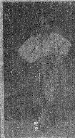
HOSPITA DE GARG