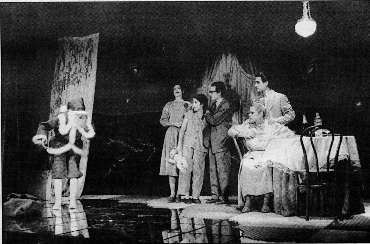
Una escena del muntatge 'Antaviana' en l'estrena del 1978 a la Sala Villarroel