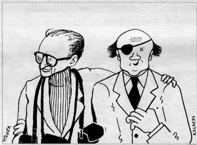
Caricatura a quatre mans: els escriptors i ninotaires es van dibuixar l'un a l'altre