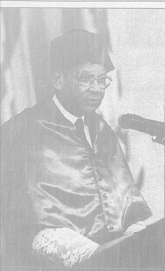
M'Bow, durante el discurso de investidura